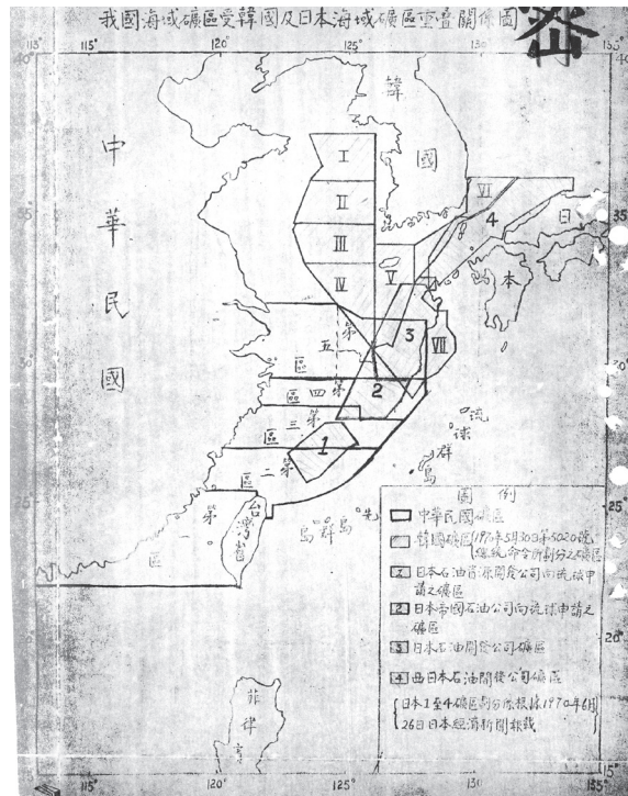
圖1、中華民國海域礦區與日、韓兩國礦區重疊圖