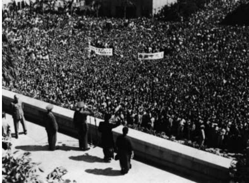
圖3 蔣中正於1946年首次來臺灣，於臺北中山堂接受軍民歡呼