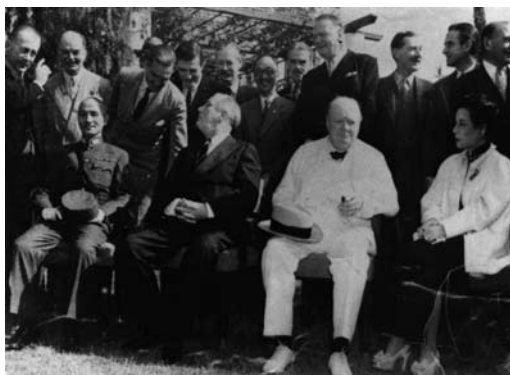
圖 1 蔣中正、羅斯福、邱吉爾、宋美齡於開羅會議留影。

1943 年 11 月 23 日，位處北非埃及首府開羅，於戰雲密布與怒火燎原之際，中國領袖蔣中正委員長、美國羅斯福總統與英國邱吉爾首相，即「三巨頭」召開戰時高峰會，研商二次大戰亞洲軍事與戰後東亞局勢等問題，史稱「開羅會議」；會後並發表了著名的《開羅宣言》（The Cairo Declaration），宣示東北四省、臺灣與澎湖等地，日本帝國所竊取侵略者，歸還中華民國。此一會議也是有史以來中國元首，首次赴海外參加外交會議，蔣中正於回程中自記：「發表於三國共同聲明之中，實為空前未有之外交成功也」。蔣中正與蔣夫人宋美齡，率領外交軍事隨員二十餘人遠赴異域，與英美首腦人物商討戰局，平起平坐（圖 1），當年開羅會議與宣言成就，揚名青史固不待言。