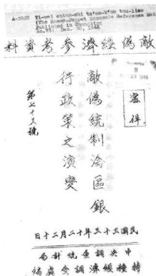
圖 6:《敵偽經濟參考資料》

為了能知己知彼,國民黨中央調查統計局特種經濟調查處蒐羅了敵方經濟資料,編輯成《敵偽經濟參考資料》。該刊為手寫油印,標有「密件」字樣,限量發行,為相關人士作內部參考,以制定應對策略。如涉及金融領域的文章就包括:〈偽中國聯合準備銀行概況〉、〈敵偽掠奪淪區中國交通兩銀行概況〉、〈敵偽統治淪區銀行政策之演變〉等。該刊從創刊起即編輯〈敵國大事志〉(後改為〈敵國大事記〉)。《敵偽經濟參考資料》的紙張和印刷都顯粗糙。戰時艱辛可見一斑。這也從側面反映中國政府如何在困難時期利用有限的資源堅持抗戰。