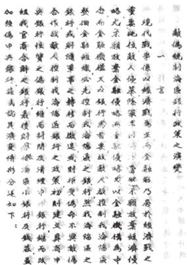
圖 7:《敵偽經濟參考資料》