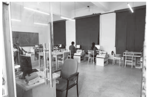
圖 3：外包廠商承接重慶市檔案館檔案數位化工作

該館外包廠商在執行數位化業務方面和本館有諸多不同之處。囊括了所有數位化前置、編頁、掃描、metadata 著錄、驗圖、拆卷後的裝訂、異地備份等工作，而重慶檔案館館方只作最後抽檢、驗收的工