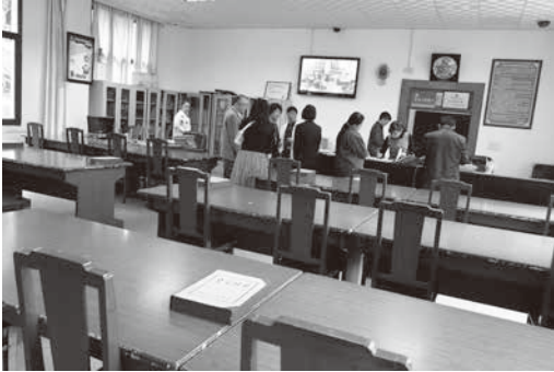
圖 5：原件檔案閱覽室內部空間