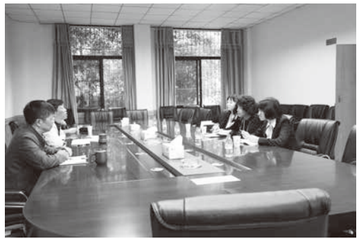
圖 2：重慶市檔案館以座談方式簡介該館概況

有企業檔案等，均為全國所獨有。2014 年 9 月，首次公布 520 多卷珍貴檔案，揭開了重慶在抗戰歷史中不為人知的一段。