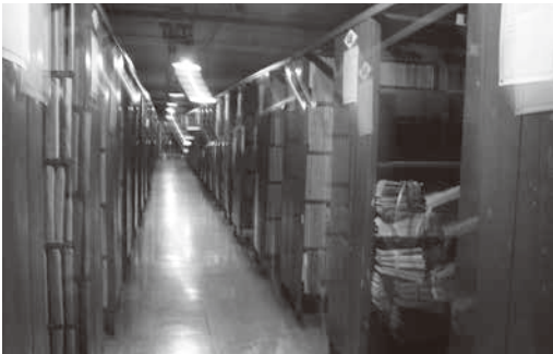
圖 6：重慶市檔案館庫房雖顯陳舊但館藏豐富

重慶市檔案館，在推廣方面，舉辦過公眾開放日活動，邀請社會公眾代表和媒體記者走進檔案館，體驗檔案的魅力，開展社會教育的功能；同時平面媒體和各網站也對此活動進行了廣泛的報導。在工作人員的引領下，我們參觀了檔案館，觀看檔案真跡，接觸了檔案鑑定、整理、修復、數位化和查詢的各個流程，增進了對該館檔案工作的認識。