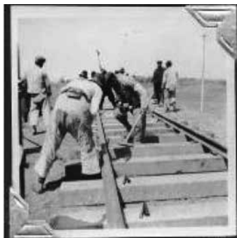
圖 8：蘇嘉鐵路施工照片

目前自本館的史料文物查詢系統中，從《交通部檔案》全宗內可歸納出 1 千餘卷的鐵道部檔案，但實際上應不止這個數目，因為有些圖表及地圖未載明清楚的時間；再者是因為鐵道部原屬於交通部路政司，民國 17 年獨立成部，民國 27 年 1 月因抗戰關