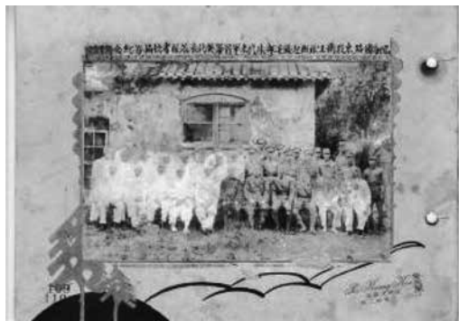
圖5：為民國25年7月隴海鐵路東段衛生隊的合照。

人事法令彙編(民國25年版)，正太鐵路李克成等9名鐵路技術員體格檢驗表及銓敘資位案，湘桂任免總卷；屬於統計方面的有中華國有鐵路會計統計總報告，中國國家鐵路統計資料(英文版，1932、1933年)；屬於衛生及育才方面的有各路局組織衛生隊及訓練案(圖5)，各路局組織看護訓練班；與經費出納相關者有京贛路、京滬路、津浦路專款調查室經費，京滬路專款留局備用款。另外尚有鐵道部所屬機構改組案及鐵道部各路設立審計辦事處案。