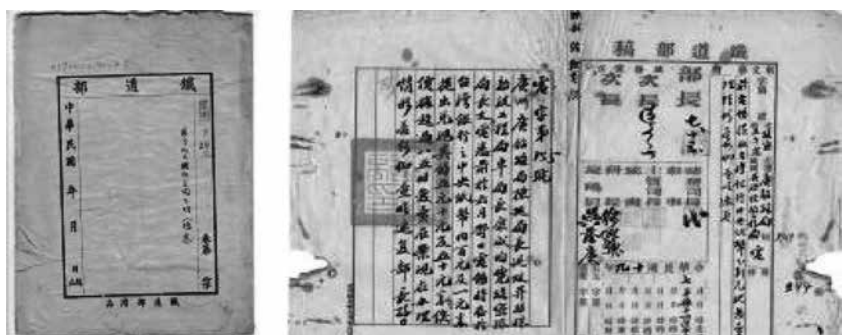
圖 1：左為鐵道部卷宗；右為民國 19 年鐵道部的公文擬稿。

類的依據，將鐵道部各司處所產生的檔案卷宗，歸為一類，才能較為客觀及全面的瞭解本館典藏鐵道部檔案的內容。