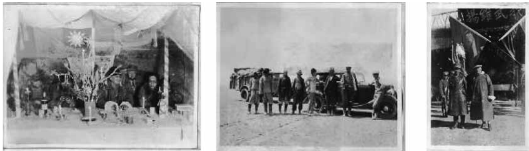
圖 4：由左至右分別為綏新公路考察隊在沙漠中度過聖誕節；考察隊向阿爾鐵密許泉出發擬直赴疏勒河；盛世才（左）與斯文赫定（右）之合照。

考察報告較重要者有鐵道部顧問漢猛德 (F. D. Hammond) 的《漢猛德將軍視察中國國有鐵路報告》一書，這是民國 24 年英國鐵路專家漢猛德將軍來華考察鐵路之報告。同年冬季，交通部長張嘉璈讀其報告，對其建議有感而發，完成《漢猛將軍中國鐵路報告之研究》一書，對中國鐵道之工務、運輸、機廠、營業及人事等各方面，指出改善之方向。另外一位著名的鐵道顧問是瑞典地理