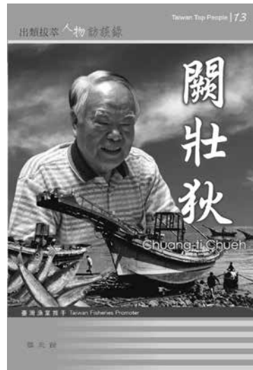
《闕壯狄先生訪談錄》封面

生，1933 年生於臺北南港，基隆水產學校畢業後，任職於經濟部漁業增產委員會、臺灣省農林廳漁業管理處，並於 1959 年進入農復會工作，從助理一職做起，長達二十年，在工作中不斷自學，藉由研習與觀摩歷練，提升知能與見識，終獲遴選為漁業組組長；1979 年農復會改組為農發會後，離開政府部門，轉職於民營的大輝貿易公司與漁業技術顧問社，深耕臺灣漁業五十餘年。在農復會漁業組組長任內培育人才、鼓勵研究、推動沿海、近海、遠洋與養殖漁業，並參與多項國際漁業合作協定之簽訂；離開農復會後從事漁產貿易、漁港工程、水產種苗協會與栽培漁業等，仍繼續為臺灣漁業盡心盡力，其全面性的經歷，娓娓述說相關人、