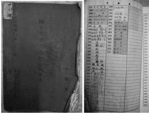
《陸軍暗號書五號（略稱陸五）》