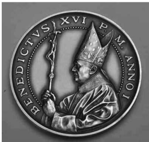
圖 2 紀念章正面

此紀念章於發行於 2005 年共計 6,000 枚，邊緣刻有發行編號，陳水扁總統於第十一任的任期內獲贈者為 173 號，馬