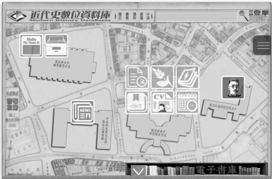
MHDB 入口網 mhdb.mh.sinica.edu.tw

(Full-text) 檢索資料庫，免費開放提供世界各地學者，申請帳號即可使用。目前共收錄 13 套資料庫，約 7,500 萬餘字，資料類型涵蓋工具書、文集、日記手稿、檔案史料，為研究中國近代史的重要利器。