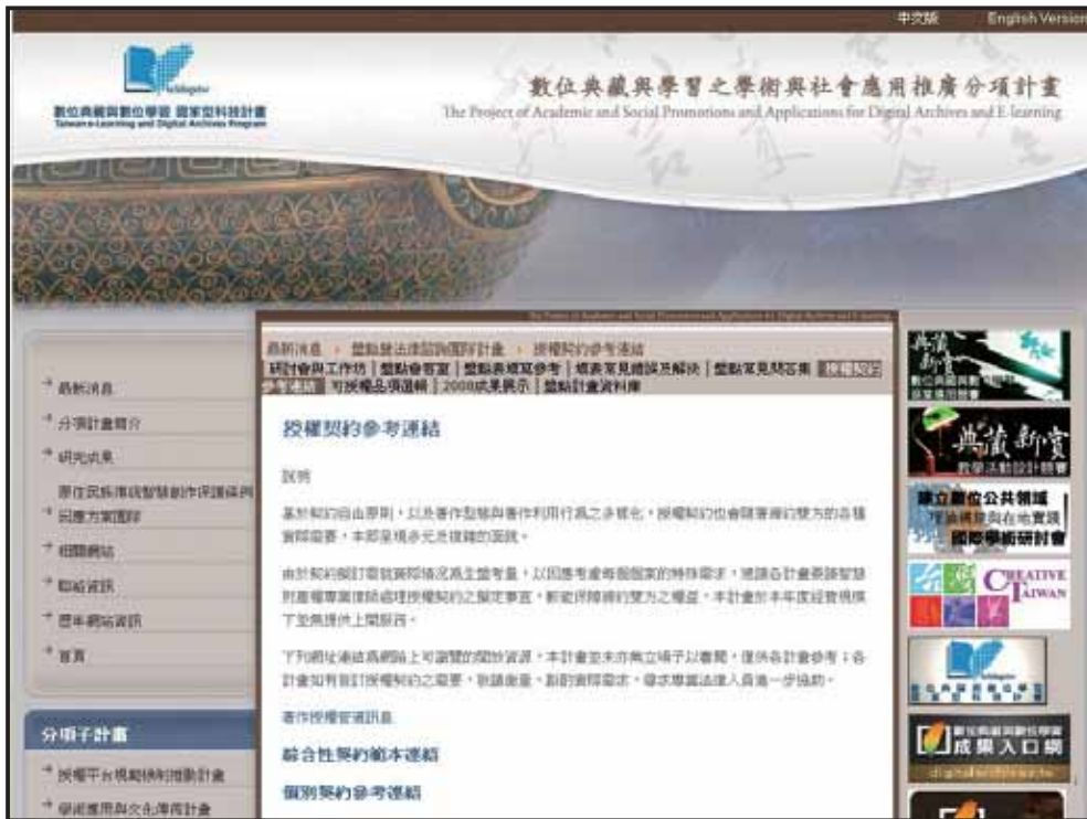
國史館數位典藏與學習之學術與社會應用推廣分項所整理的授權契約範例