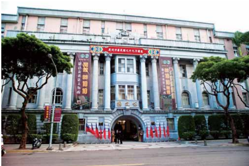
「總統副總統文物館」外觀