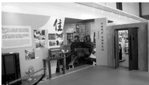
「住」的主題。