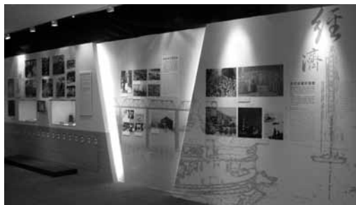
「促進經濟繁榮，塑造臺灣經驗」主題。

「經濟」主題，運用照片、文物及圖表，述說由傳統的錢莊、票號，到近代銀行等的發展；抗戰期間仍致力交通建設，如民國 26 年湘桂鐵路、30 年成渝公路等的通車；政府遷臺後，在風雨飄搖中埋首建設，如行政院長蔣經國推行十大建設等，加之全民辛勤打拼，成就舉世聞名的「臺灣奇蹟」；民國 69 年新竹科學園區成立，標誌臺灣邁向科技時代。這些成績，具體彰顯在臺灣 GNP、GDP、NI 等，一直不斷上升的經濟指標中。此外，民國 99 年臺灣共有 35 項產業 / 產品（含海外生產），進入全球前三大。這些傲人成就背後的重要推手，亦選輯在數位相框展示。