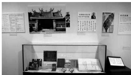
「變局中開創新局的臺灣」主題，展櫃展出馬關條約複製件、1920年代臺灣治警事件入獄紀念章及臺灣革命同盟工作報告等珍貴史料。

中華民國的建立與茁壯，與臺灣有著密切的關連。1895年，馬關條約割讓臺灣的同一年，孫中山也發動廣州首義，以收復失地為職志。臺籍人士羅福星曾參與三二九之役；林祖密追隨孫中山護法革命；為對日抗戰成立的「臺灣革命同盟會」、「臺灣義勇