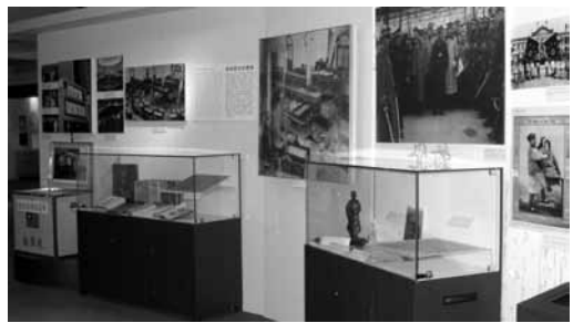
「開創民主共和新局」主題。

歷史區入口投影，展示了一張國父孫中山先生手書「民國」之意的墨寶。他所堅持的民主理念，留給中華民國彌足珍貴的遺