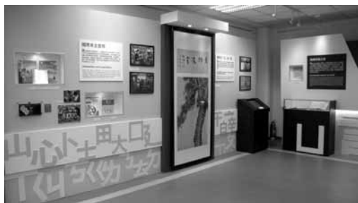
「語言文字」主題。

本主題展出民國初年與白話文運動關聯極大的幾篇重要文章，如胡適先生的《文學改良芻議》，陳獨秀先生的《文學革命論》，以及第一篇用白話文寫成的短篇小說——魯迅《狂人日記》，這些文章當年都發表於《新青年》雜誌，除以電子書形式展出文章的內容，也將復刻再印的《新青年》雜誌選輯展出。而為表現漢字之美，特別自國史館館藏中選出書法名人于右任先生與蔣經國總統之書畫合璧作品「貞幹凌霄」，從中