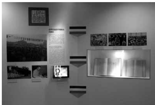
「世界四強與平等新約的締訂」單元，以「中華民國國書」為設計造型。

「外交」主題，以「國書」之展版造型為視覺中心，旨在展現中華民國掙脫不平等枷鎖，邁向主權平等的外交地位。相關展件