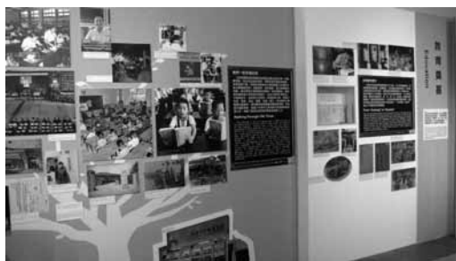
「教育」主題。

自清末引進的新式教育，在 1905 年科舉廢除後，更快速發展。民國肇建，公私學堂紛紛轉為學校，各省市地方普設師範教育、中小學教育機構，國民素質逐漸提升。北伐後國民政府規劃在各省成立國立綜合大學。抗戰爆發後，各校或另覓新校區，或聯合他校隨政府西遷，依然絃歌不輟，如昆明的西南聯合大學等。政府遷臺後，除延續日據時期小學教育的規模外，在地方擴充中等學校。高等教育方面，民國 40 年起，東吳、政治、清華、交通、輔仁、中央等各大