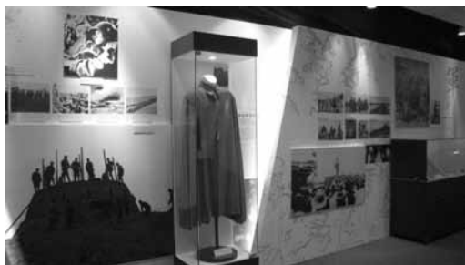
「戰爭與和平」主題。

摧毀帝制的急先鋒，雖有建立民國之功，卻因分屬地方勢力，亦使政局不安。一百年來的中華民國，走過軍閥割據、對日抗戰、戡亂戰爭與臺海戰役等。本主題透過包括西洋畫報刊載之中國軍隊仿效西方訓練的照片、「山西革命軍布告」（山西革命軍呼應武昌起義，截斷清廷對武漢的補給，確保革命的成功）、抗戰時期毛澤東呼籲國共兩黨應在蔣委員長領導下聯合抗日的信函、蔣中正五星上將披風、日本向中國戰區統帥投降降書、抗戰大刀、八二三戰役相關資料與兩岸心戰喊話的空飄傳單等史料文物，期使觀眾更加瞭解中華民國國軍由簡窳成軍到建軍衛國的奮鬥歷程。