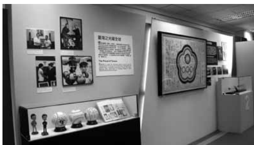
「力與美的呈現」主題中的「臺灣之光耀全球」單元。

國民間普遍內蘊的樂善好施美德，以及尊重多元文化的社會共識，都為眾人在這一百年中為邁向「禮運大同」理想社會所做之種種努力，留下許多燦爛的記憶痕跡。