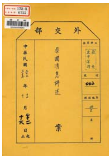
28年至34年9月國名為「泰國」