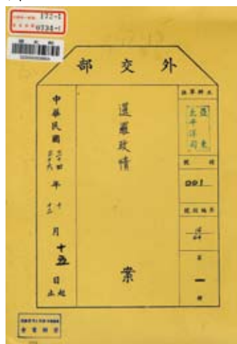
34年9月至38年國名為「暹羅」

加上「現名」以利檢索，如：暹羅（泰國）、高棉（柬埔寨）、上伏塔（布吉納法索）等；其次，卷名內的國名若係兩國並列之簡稱，亦以上述原則辦理，如：中暹（泰國）關係。