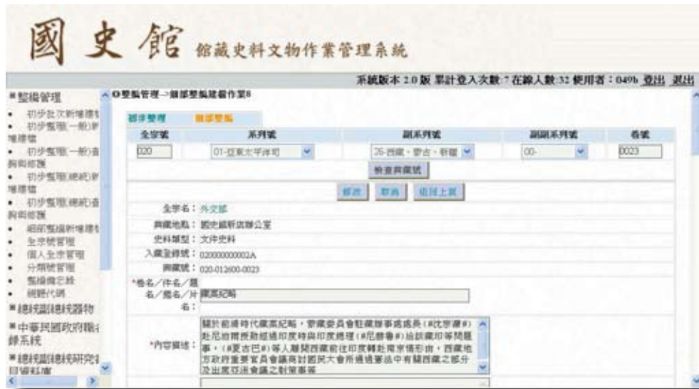
圖4：「國史館史料文物作業管理系統」網頁

前置作業初始即清查核校各案卷，發現各卷中仍散見註有各級機密等級字樣，尚未雙線劃除，亦未貼有機密等級註銷