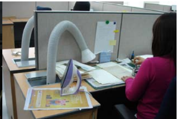
韓國國家檔案館有10台檔案微捲機，圖為拍攝情形（陳憶華攝） 微捲拍攝前之檔案進行編號、吸塵及燙平前置作業（陳憶華攝）