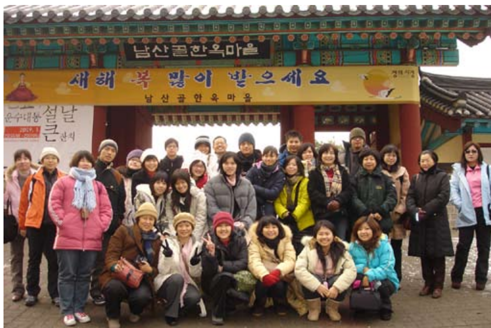
韓國首爾學術參訪交流團全體合影