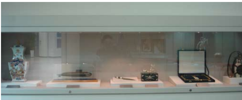
總統文物展覽廳內陳列來自世界各國贈送之文物