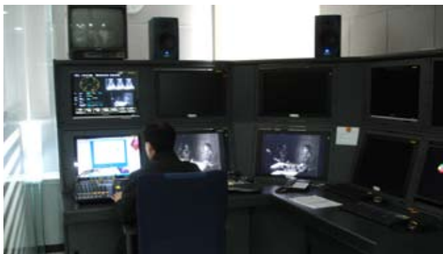
韓國國家檔案館具備各種設備自行轉檔轉拷