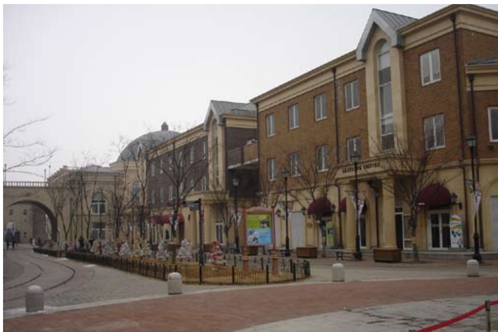
韓國坡州英語村內之建築均為歐美式