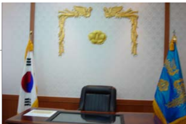
文物展覽廳中之「總統辦公室」