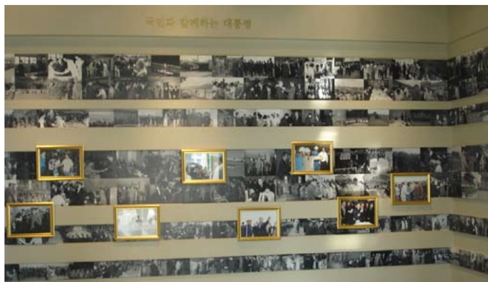
總統文物展覽廳內利用照片展示「總統和人民」主題

4廳——「總統辦公室」：重現總統辦公室之場景，包括辦公桌椅、總統府標誌及國旗，讓前來參觀的人們可在總統辦公桌椅旁照相留影，填寫留言簿，