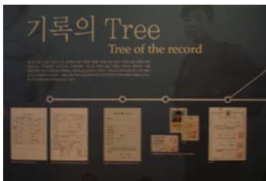
個人文件的樹狀圖展示告知我們身邊有哪些可貴的證件與檔案