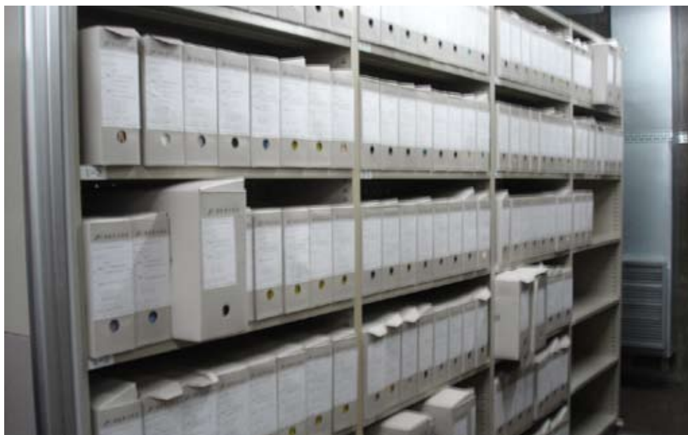
韓國國家檔案館一般檔案庫房典藏情形