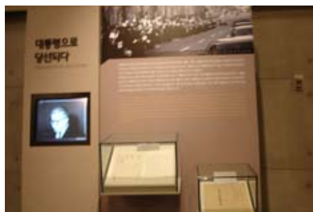
總統展覽廳中利用照片、檔案與多媒體放映一同展示