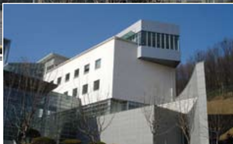
側棟建築是展覽、閱覽及訓練空間