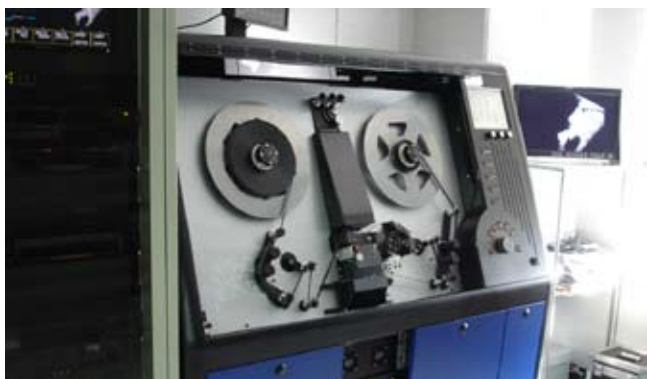
這套多媒體設備由美國進口，費用約為10億韓元