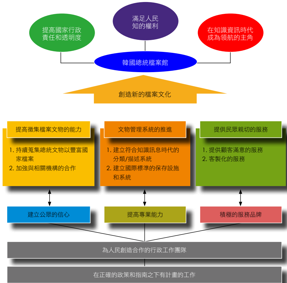
圖1：韓國總統檔案館的任務與願景