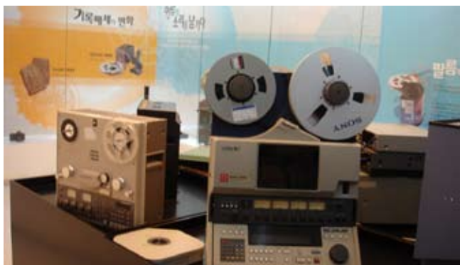
韓國將各種舊式影音設備保存並作展示