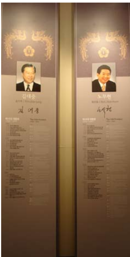
韓國歷任總統之照片及大事年表簡介

總統檔案館內典藏了從第一至十七屆總統的檔案、文物、電子文件等共三百二十餘萬件。其中由李承晚至金大中總統蒐集之檔案為220,467件、視聽史料（錄影、錄音、照片、影片）計79,605件、電子資料計30,624件、行政博物（國璽、傢俱、協議書、宣傳海報、明信片、入場券、郵票等）計393件，共計331,089件。自「總統檔案文物管理法」公布後，盧武鉉、李明博總統之文件也已陸續進館。以下就將此三階段進館之文物做一詳細統計，「總統檔案文物管理法」制定前保存之檔案文物統計如表2，「總統檔案文物管理法」制定後所典藏之檔案文物統計如表3、4。