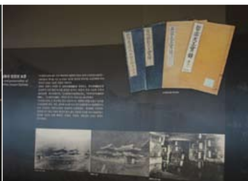
善本書配合圖片與文字詮釋朝鮮王朝的盛世