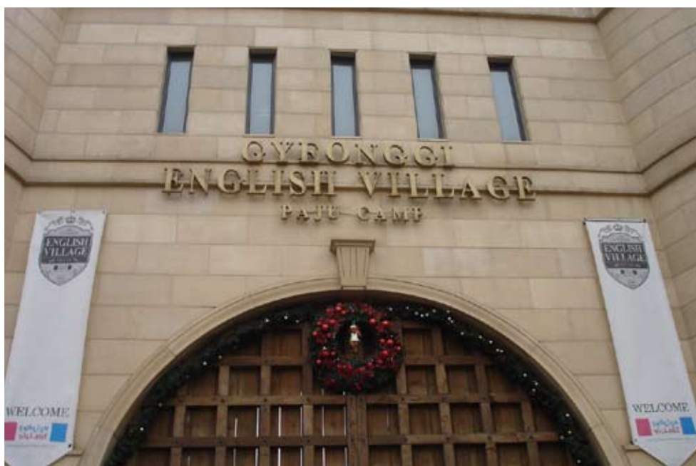
韓國坡州英語村入口處之大門