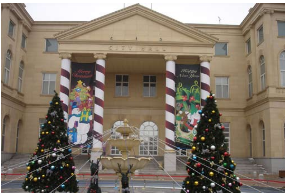
英語村內模擬現實「市政廳」情境之市政大樓

成立英語村的目的是在於提供一個可以不用出國，不用大筆花費就可以留學的經驗，利用不同形式的教材與活動進行英語學習，讓外籍老師與學生進行各