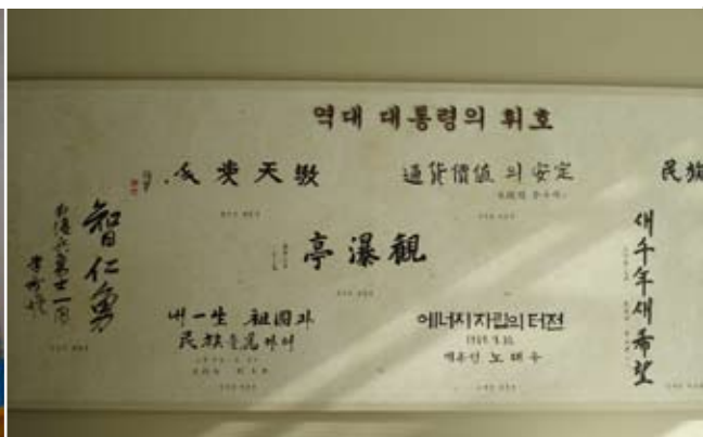
韓國歷屆總統之簽名字跡全部集中於一面牆上

總統文物展覽廳共有390平方公尺（118坪），展示總統的照片、重要文獻、總統任職期間重要活動影片和總統訪問國外收到的禮品。展示廳共分成六個廳，各廳之展覽主題與物件如下：