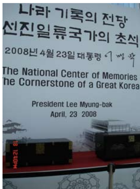
2008年4月23日現任韓國總統李明博的簽名與題詞

盧武鉉偕夫人權陽淑特地到總統檔案館和NARA國家檔案館訪問，聽取簡報、移交現狀及參觀庫房和展覽，足見高層對檔案的重視。檔案是過去、現代乃至未來的樞紐帶，各種文件紀錄也將成為家族、國家的歷史，韓國積極追求世界級的檔案文化，推廣輝煌的檔案傳統，這些都是值得我國所借鏡的。