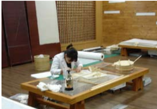
總統檔案館及NARA檔案館共同之修護室修補檔案情形