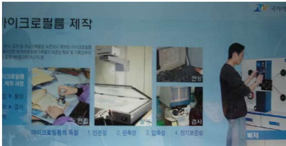
韓國將檔案製作微捲、微片的過程以示意圖告訴來館參觀者