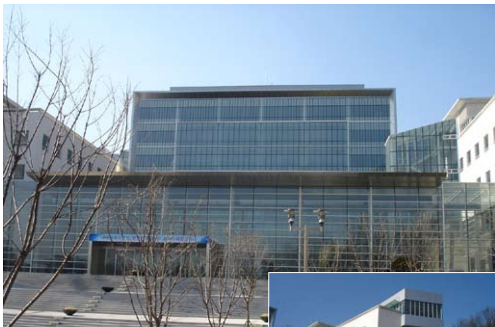
韓國總統檔案館與NARA檔案館在同一棟建築，其外觀意象為「國家歷史記錄的珠寶盒」，2008年正式對外開放。本圖為正門入口處。