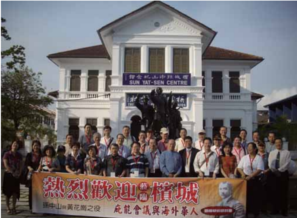
與會學者於檳城孫中山紀念館前合影

，所呈現的多重歷史面向。經過仔細核對黃興等四人的說法，不難發現他們認知間的差異點，其實非常有限。持平來說，在當時，就有不少黨人對於黃興針對姚等三人的嚴厲態度，持不同的看法，而此役失敗的主要原因，與其說是姚、胡、陳三人未能依計畫行動所致，還不如說是黨人之間為了保密，各機關互不通聲氣，以致消息阻隔，加上起義時間一變再變，起義計畫反覆不定，香港方面的同志也無所適從，在當時已有不少同志引以為憂，而這可能才是黃花崗之役功敗垂成的最大原因。