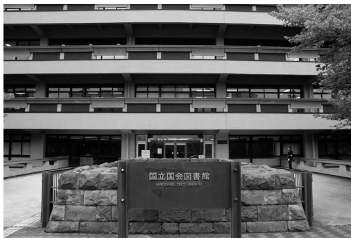
◎日本國立國會圖書館正門

町站最近，由 2 號出口出去即可看見位於馬路對面的圖書館建築物，步行約 3 至 5 分鐘；也可搭乘半藏門線或南北線，都是永田町站下車，由較近的 3 號出口步行約要 5 至 8 分鐘；另也可搭乘千代田線或丸之內線，則是在國會