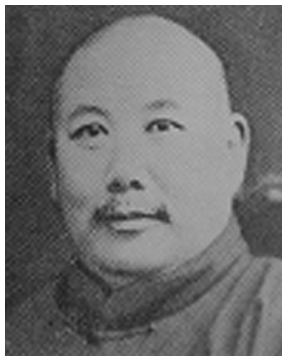
寧夏護軍使馬福祥

（銜略）福祥（註）虞（7）日上大總統（黎元洪）一電，文曰：「前聞內閣搖動，當以外交日逼，內政宜堅，上月養（22）日電請維持。旋接軍事會議各督軍通電，知憲法議案束縛行政太過，恐流為暴民專制。漾（23）日電陳利害，請予救正，蓋逆知此等憲法不適中國國情，全國官民必難承認。不料上月二十三日，段總理（祺瑞）免職之令忽頒。我大總統再造共和，實行法治，寬仁厚德，薄海共諒。勢逼出此，或有萬不得已之苦衷。而各省督軍，恐憲法不良，遺禍將來，聯銜上呈，遂有萬不得已之請願。段總理軍事經驗全國共悉，矧當中德絕交，尤國防安危所繫。突予免職，群情憤激，致有鬻拳兵諫之例，求遂為民請命之心，若不從速轉圜，大局何堪設想。平心而論，臨時約法原多偏重，此項議案，更加束縛。上年國會搗亂，經我大總統主張解散，既經重行召集，宜如何懲前毖後，議決政府提出之要案，迅赴事機，議定我國適用之憲條，以維根本。乃一年以來，以莊嚴議會之資格，作肆無忌憚之行為，推其原