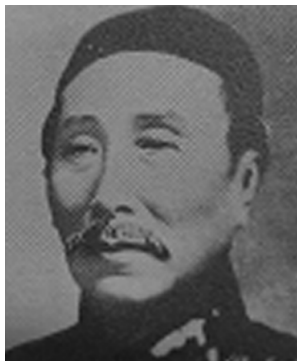
代國務總理伍廷芳

國會為調停辦法，并謂此外亦別無善策。惟茲事體大，不厭求詳，且約法無解散國會明文，倘非全國意見相同，未可遽然從事。如果非依此解決，大局恐至糜爛，則法律與事實，勢難兼顧。諸公深明大義，以國家為前提，務希剋日電示卓見，以期有所取舍。幸甚。伍廷芳叩。真。