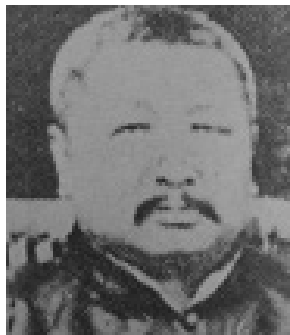
廣州軍政府總裁岑春煊

南京馮副總統（國璋）鈞鑒： 齊省長（耀琳），保定曹督軍（錕），開封趙督軍（倜）、田省長（文烈），太原閻督軍（錫山），西安陳督軍（樹藩）、李省長（夢彪），蘭州張督軍（廣建），迪化楊督軍（增新），武昌王督軍（占元），長沙譚督軍（延闓），南昌李督軍（純）、戚省長（揚），杭州楊督軍（善德）、齊省長（耀珊），成都戴兼督（戡），敘州羅前督（佩金），雲南唐督軍（繼堯），貴陽劉督軍（顯世），南寧陸巡閱使（榮廷）、譚督軍（浩明）、劉省長（承恩），廣州陳督軍（炳焜）、朱省長（慶瀾）、李軍長（烈鈞），奉天張督軍（作霖），吉林孟督軍（恩遠），齊齊哈爾畢督軍（桂芳），上海海軍程總長（璧光）、薩總司令（鎮冰）、盧護軍使（永祥）、孫中山、唐少川（紹儀）、章太炎（炳麟）、汪精衛（兆銘）各先生，熱河、歸化、張家口各都統，各省鎮守使，各師旅長，省議會，並轉各報館，天津朱省長（家寶）、徐菊人（世昌）、段芝泉（祺瑞）、李仲軒（經義）、梁任公（啟超）、熊秉三（希齡）、湯濟武（化龍）各先生均鑒：邇者群