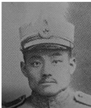
第七師師長張敬堯