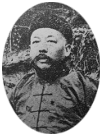
京師警察總監吳炳湘

（銜略）密。頃接吳鏡潭（炳湘）（註1）、陸朗齋（建章）（註2）兩兄冬（2日）電開：「國是顛倒，政治日非，午夜憂慮，補救乏術。比來天心悔禍，動機發觸，都城內外軍隊，盡屬北派團體，如手如足，當然一致。數月以前，早經結合，惟陳秀峰（光遠）、江雨澄（朝宗）二人，接近公府，未便輕率與聞。日來大局如是，已獲同心，毫無隔膜，全體議定，密電奉告。凡都城治安，此間當然力任，至一國艱難，仍仰京外倡義。諸公碩畫蓋籌，有何見諭，期盼佳音。此後如有電示，望用宙密致北京吳總監（炳湘），並分轉陳督練（光遠）、江統領（朝宗）、陸朗齋為盼。」等因。當即電覆，文曰：「北京吳總監定密，並轉陳督練、江統領、陸將軍（建章）同鑒：冬電敬悉，佩慰無似，當轉電同志各省，一體知照矣。敝處及魯、豫各軍隊，均於昨晨北上，一二日內，當可會師近畿，迅求解決。都城秩序，有諸公力任，本在計中，茲承示及，更屬放心。惟此次軒然大波，皆由府會宵小勾結播弄而起，非擇重要之十餘人，嚴予懲處，不足以平天下之氣。尚祈密佈網羅，勿任逃匿為要。若輩兇險性成，蹙之過激，不能不慮其挺而走險，或生破壞秩序之心，應如何故示寬閒，