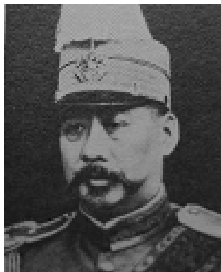
淞滬護軍使盧永祥