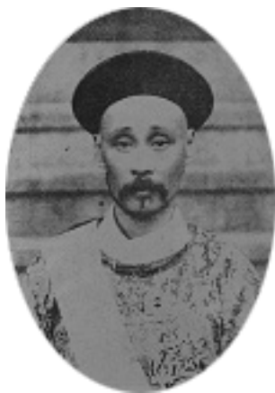
外務部尚書梁敦彥

（銜略）宣統九年五月十三日上諭，內閣閣丞著萬繩栻（註1）、胡嗣瑗（註2）補授，欽此。內閣議政大臣張勳。宣統九年五月十三日上諭，外務部尚書著梁敦