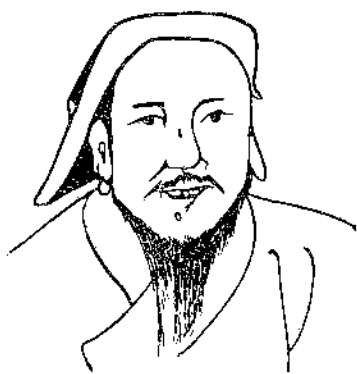
元太祖成吉思汗像