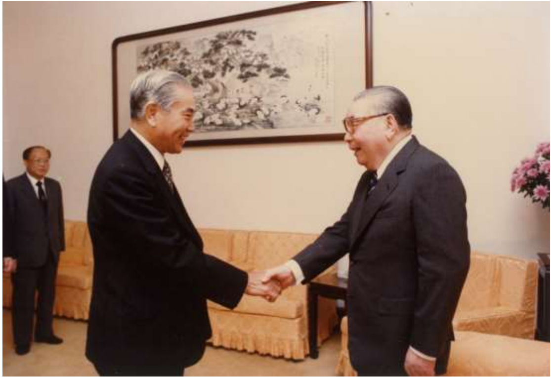
蔣經國總統接見鹿內信隆 1985.10.21