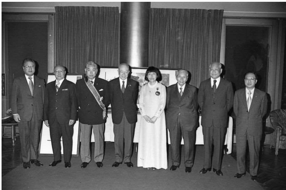
贈勳儀式後與會人員合影(左 1 為教育部部長蔣彥士、左 3 起為產經新聞社長鹿內信隆、產經新聞會長植村甲午郎、鹿內英子、總統府資政張羣、國民黨中央委員會委員長張寶樹及國民黨黨史委員會主任委員秦孝儀)