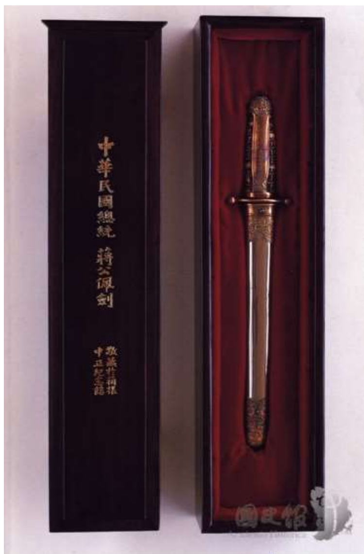
本次捐贈物件之一，「中正劍」 (國史館，典藏號 002-050114-00002)