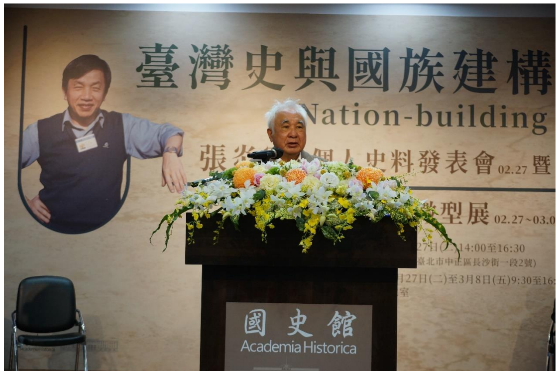
總統府資政姚嘉文先生致詞