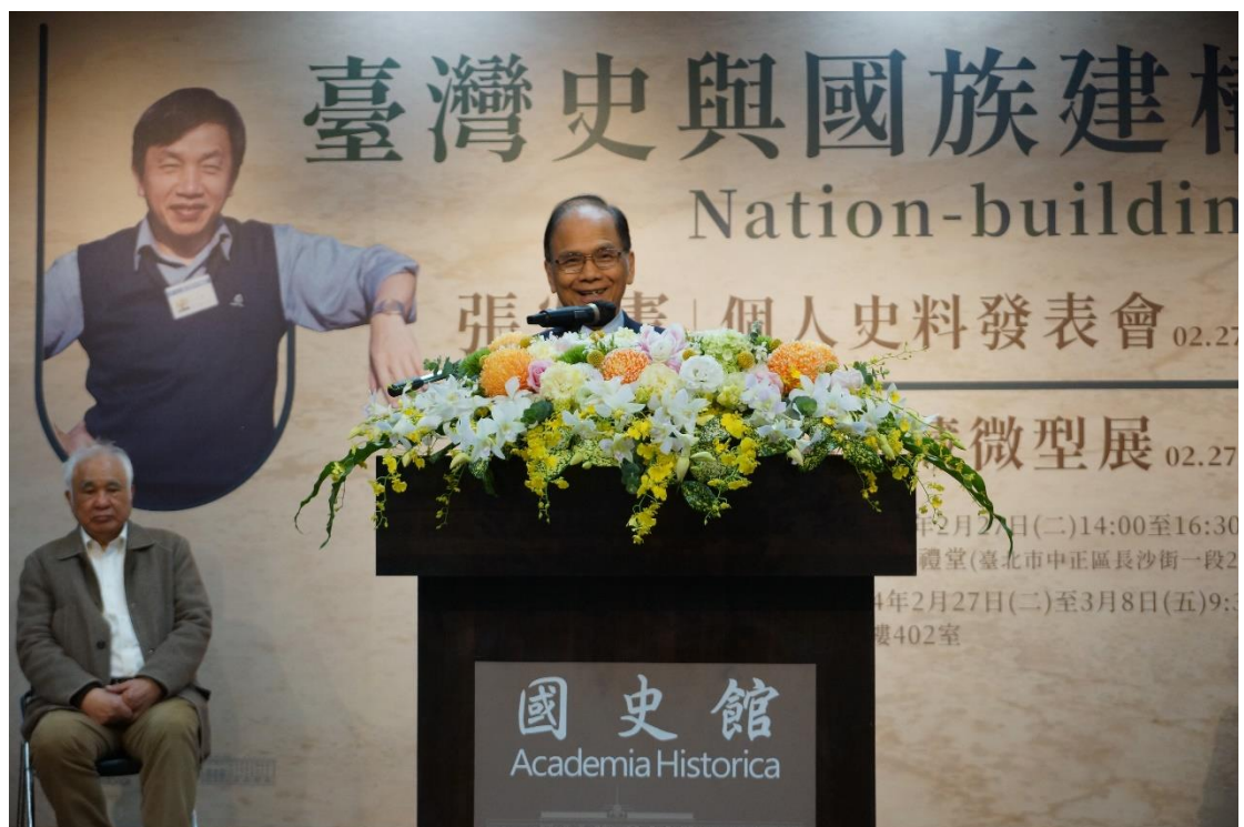
前立法院院長游錫堃先生致詞