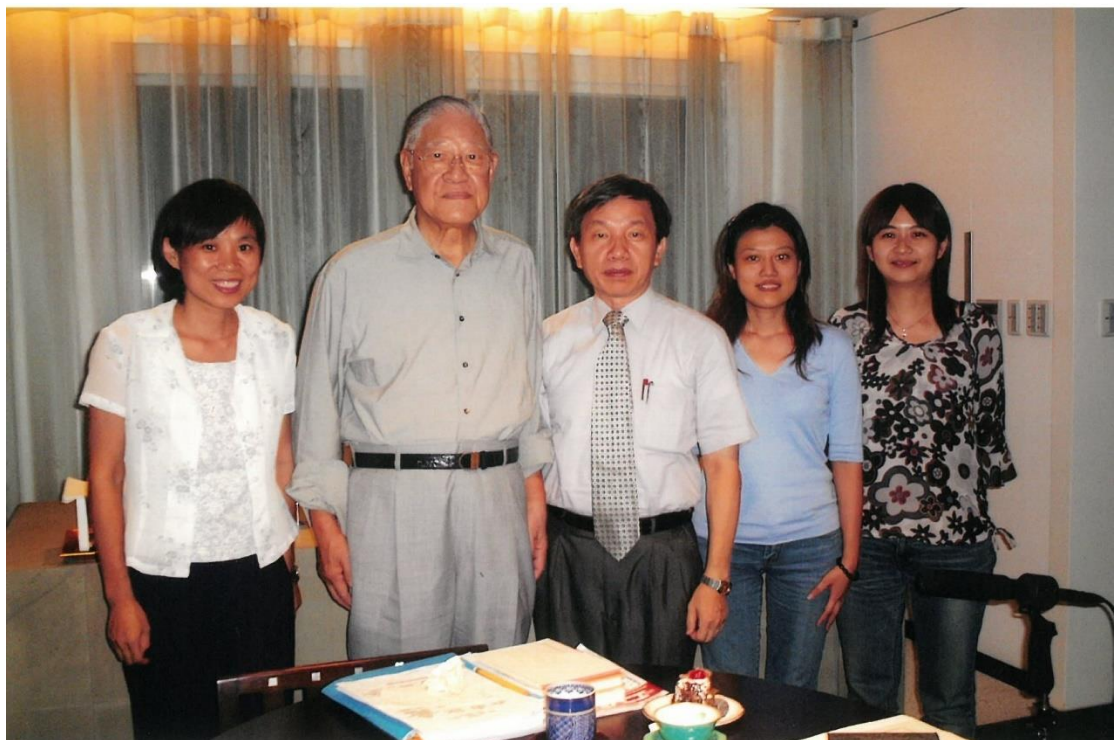
李登輝前總統口述訪談後與訪問人員合影(2003)