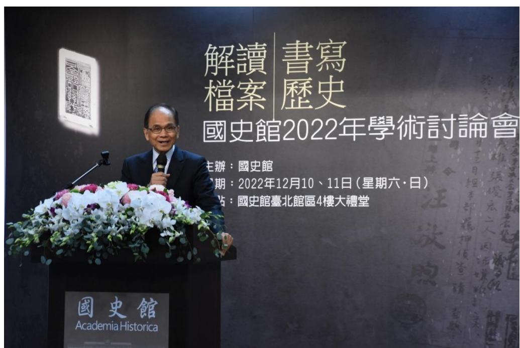
立法院游錫堃院長致詞