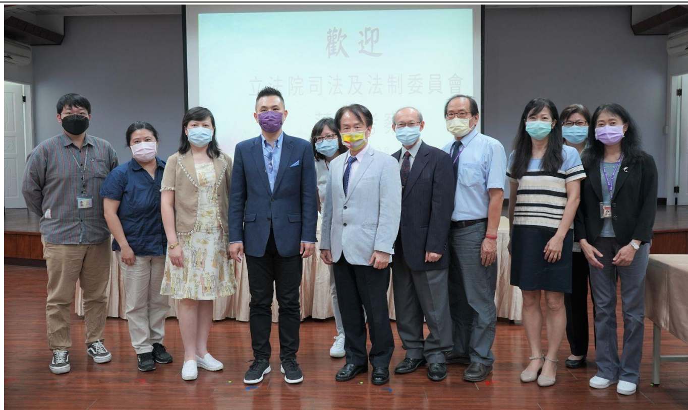
20220728 立法院司法及法制委員會蒞館考察，陳以信召委率同仁與國史館陳儀深館長及主管合影。左起立法院江明濤助理、王靖淳科員、陳杏枝簡任秘書、陳以信召委。右起本館黃秀妃處長、邱玉鳳處長、歐素瑛處長、黎中光主任秘書、許瑞浩副館長、陳儀深館長以及陸瑞玉處長。