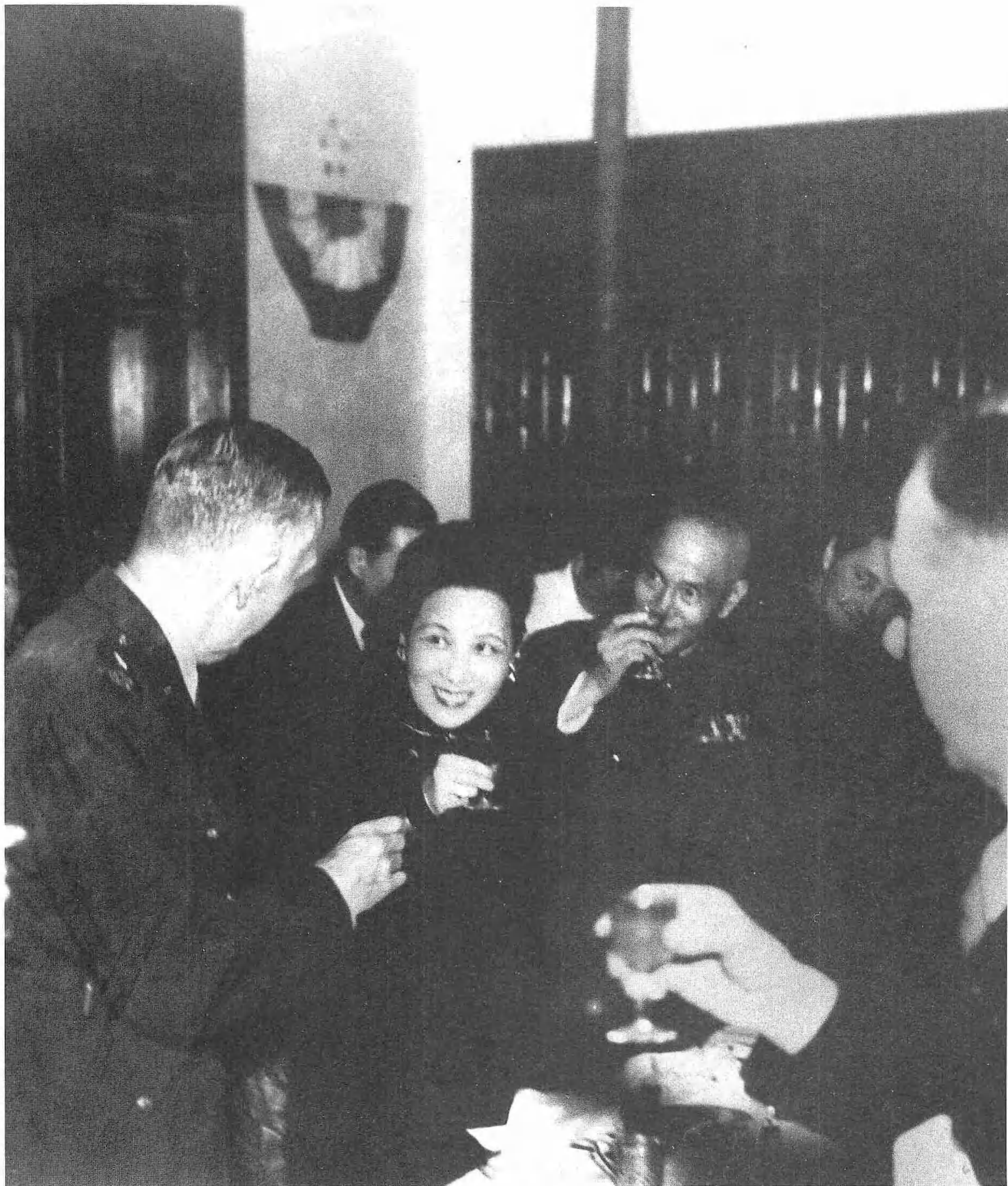
1945年12月底蔣主席夫婦在官邸設宴歡迎馬歇爾將軍。