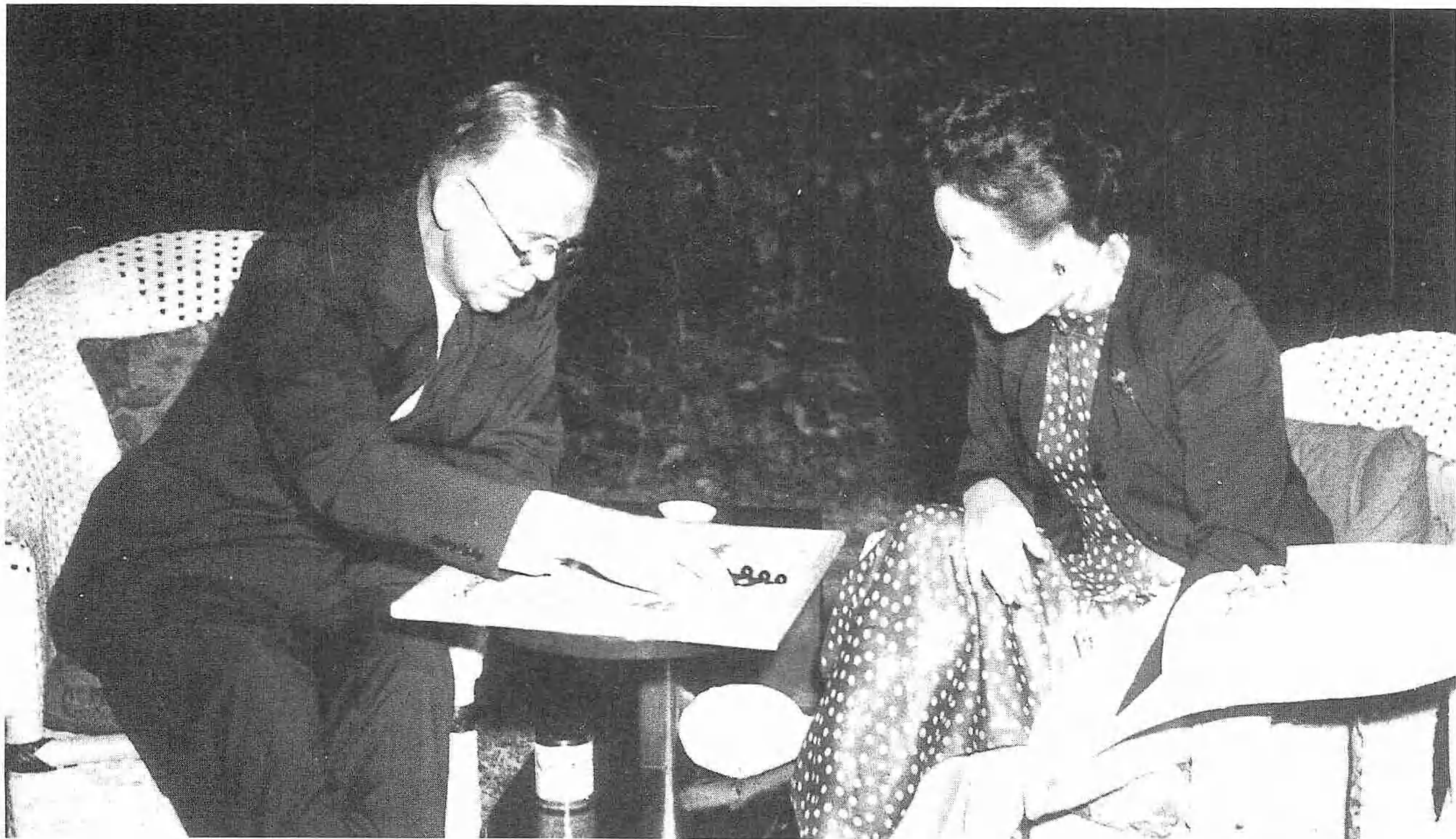
蔣夫人與馬歇爾在牯嶺下棋。