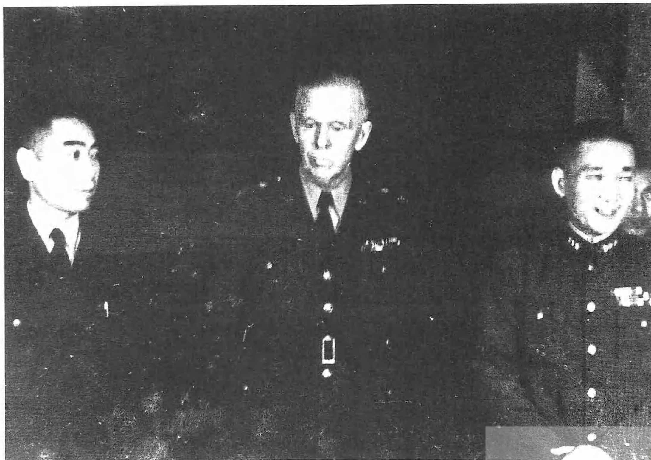
1946年2月25日馬歇爾與周恩來（左一）、張治中（右一）在簽訂整軍協定後合影。