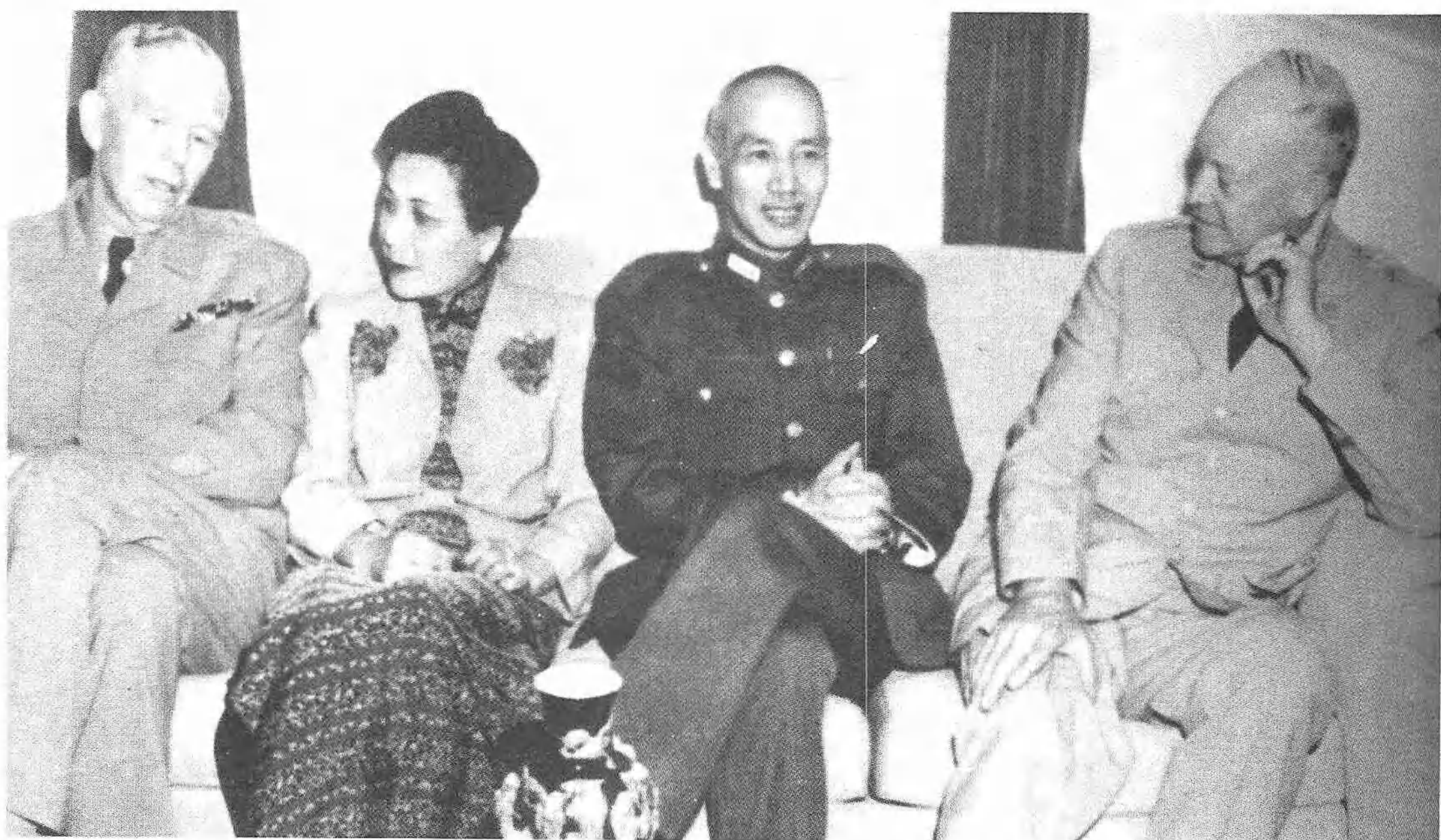
美國參謀總長艾森豪（右）於1946年5月9日抵南京，蔣主席設宴招待，馬歇爾亦列席。