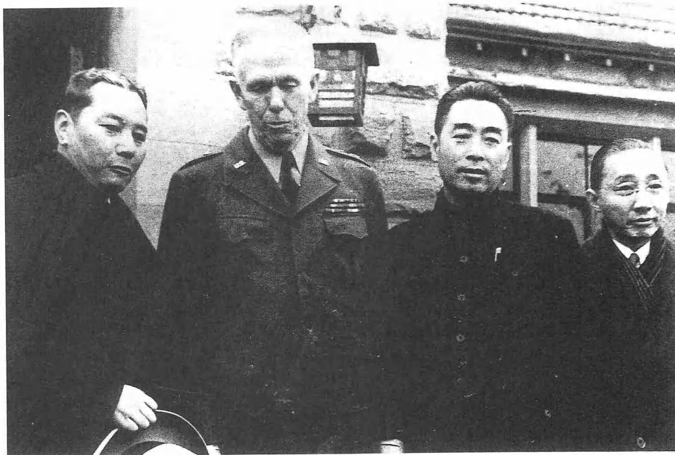
馬歇爾與三人小組另兩位成員張群（左一）、周恩來（右二）在1942年1月合影。