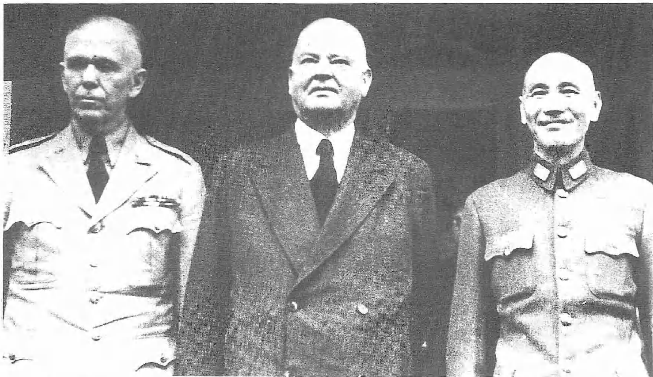
美國賑災特使前總統胡佛（中）於1946年5月3日抵南京，與蔣主席與馬歇爾合影。