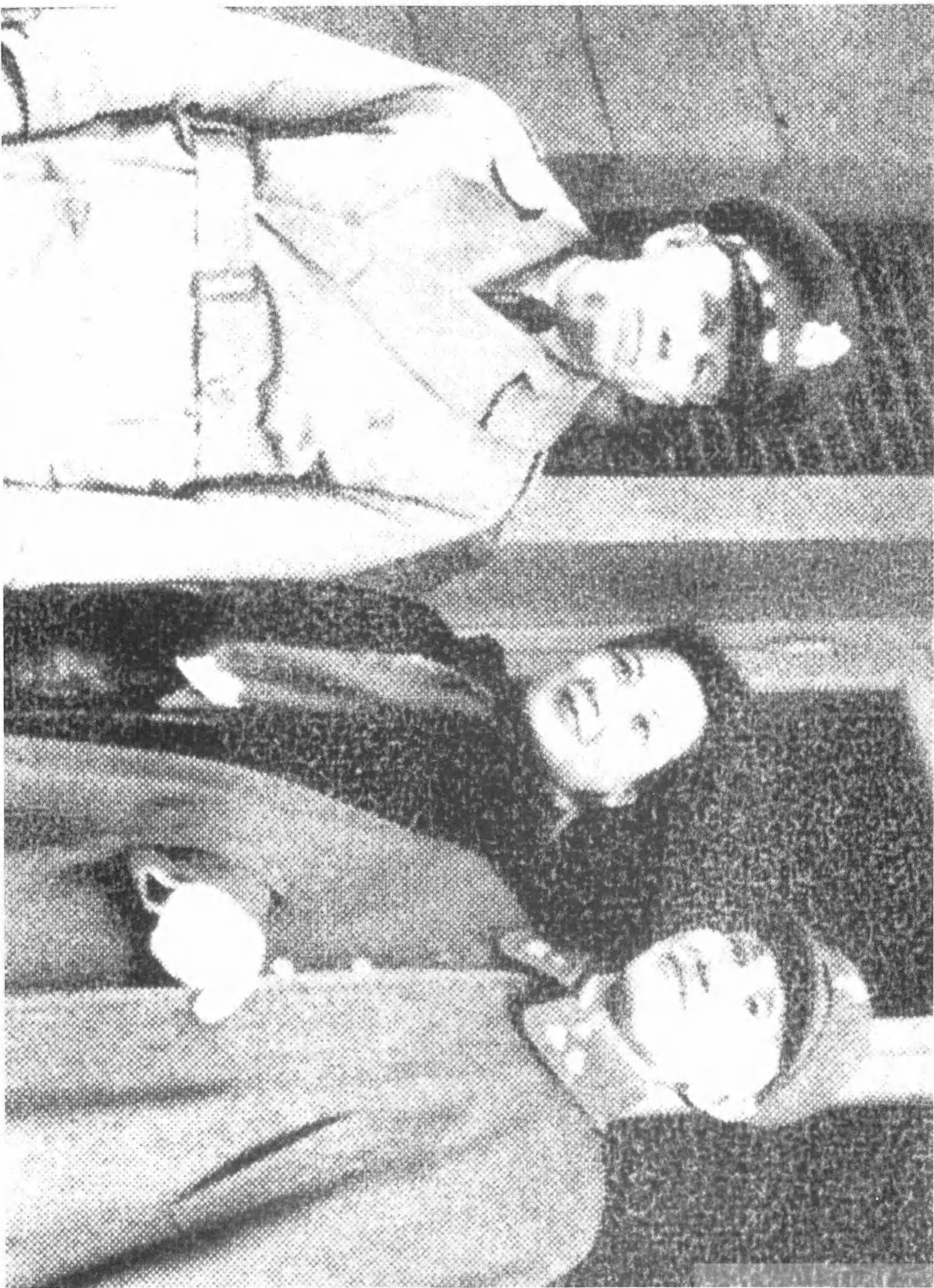
1945年12月21日馬歇爾飛往南京，晉謁蔣主席夫婦並合影。