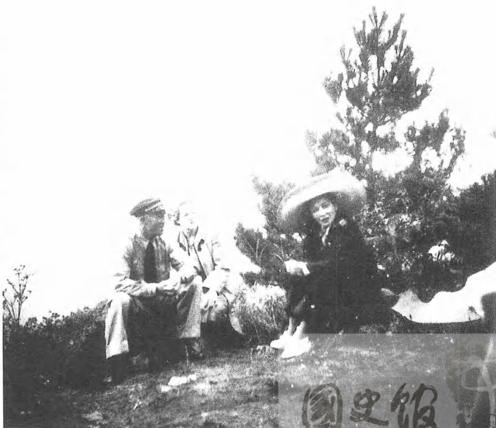
蔣夫人與馬歇爾夫婦在牯嶺賞景。