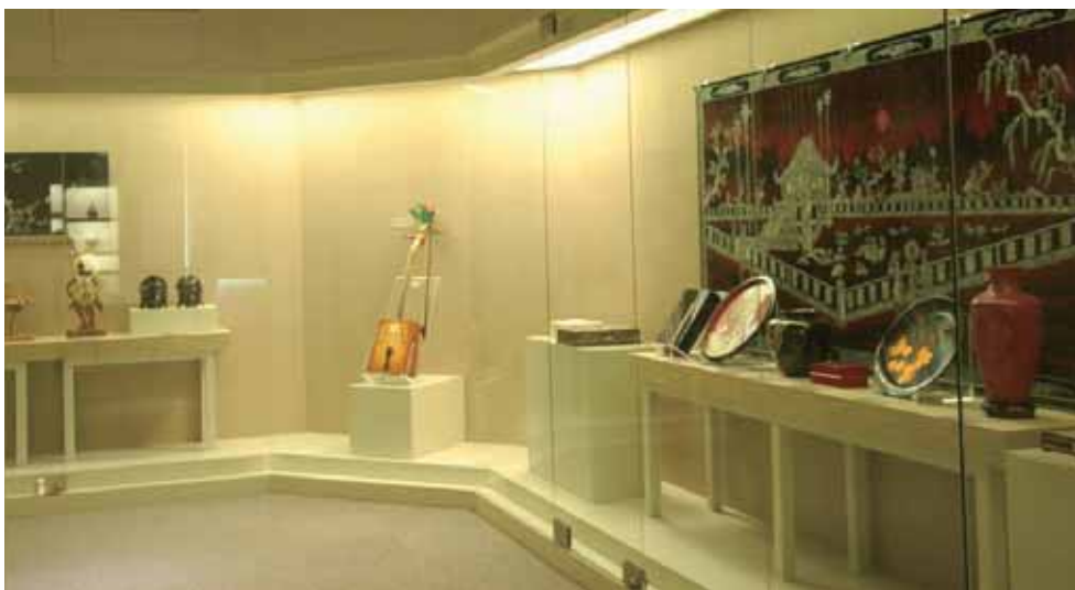
「總統副總統文物館」展場一隅