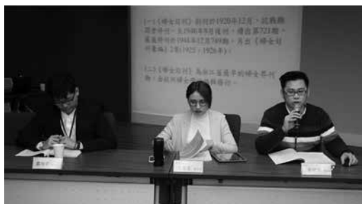
圖9：第九場次發表狀況

第三位報告人為政治大學歷史系碩士生朱紹聖，題目為〈日本外交官重光葵眼中的1920年代中國〉。報告人透過隨筆及回憶錄，以及近人的相關研究，梳理日本外交官重光葵對1920年代中國局勢的整體觀察，及這樣的認識如何影響到他在對華外交工作上的態度。