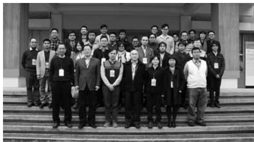
圖 11：全體與會學者合照

本次由政治大學歷史學系與中國近現代史讀書會聯合舉辦的「百變民國：1920 年代之中國」青年學者論壇，成功地召集了民國史界目前 20-30 歲左右的研究者。目前學界的中堅學者亦共襄盛舉，為後進提供了在撰寫研究計畫和發想論文過程的一個腦力激盪的機會。筆者有幸躬逢其盛並親歷參與，特撰此文，因以為記。