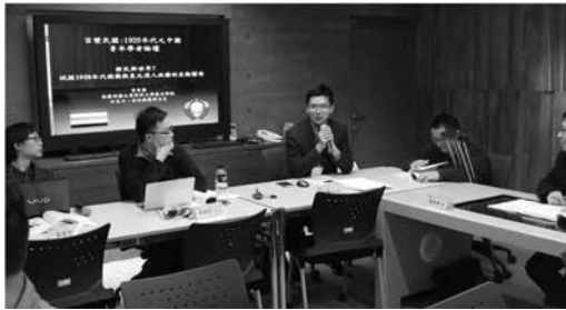
圖 6：第六場次發表狀況

鍵。報告人透過對「黨團」機制的考察，還原這一對組織、宣傳、外聯等，滲透、整合、掌控群眾團體，掀起群眾運動的洪波，化無形為有形的組織機制。