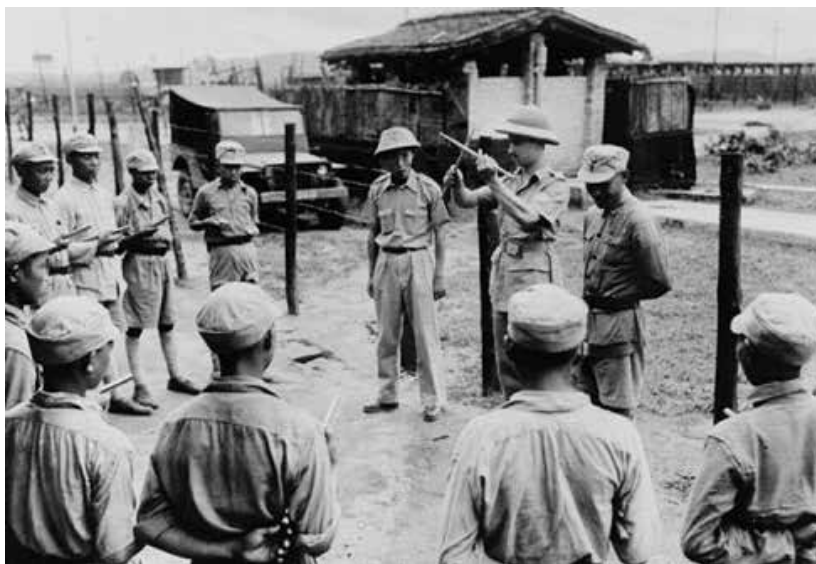
圖6：1942年，卡爾·阿諾德少尉在印度給中國士兵演示如何敲鼓

姆伽，8月初，從緬北野人山脫險入印的第五軍新二十二師和軍直屬部隊也來到了藍姆伽。根據中美協議，遠征軍第一路司令長官部撤銷，改稱為中國駐印軍總指揮部。史迪威為總指揮，羅卓英為副總指揮。同時，國民政府利用駝峰空運飛機回航的機會，每天空運幾百名士兵到印度，以補充兵源。他們在中國戰區參謀長史迪威的指導下，在蘭姆伽訓練營接受整訓。訓練營由美各兵種軍官組成，對中國士兵開展各兵種訓練。步兵團的迫擊砲、戰車防禦砲、火箭筒、重機關槍、輕機關槍、衝鋒槍直到步槍和手榴彈都在訓練之列。此外，部隊還有工兵營、通訊營、輜重營的訓練，甚至汽車駕