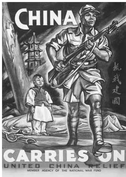
圖 7：文宣畫「抗戰建國」