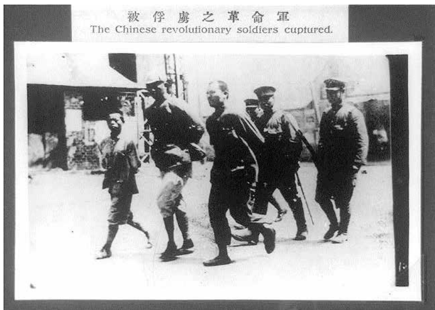
圖 1：濟南事件中被俘虜的國民革命軍