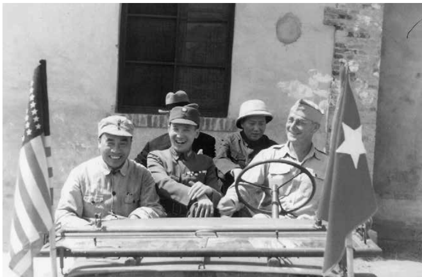
圖 12: 左起: 朱德、張治中、(後排) 赫爾利、毛澤東