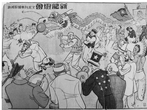
圖11：新龍燈會

主題一目了然。畫中可辨認的人物有美國山姆大叔、法國的戴高樂、英國首相邱吉爾。左下角所繪之人竟酷似德國元首希特勒。該畫作畫的時間不詳。根據邱吉爾1940年5月10日起任英國首相和詹森大使1941年5月離任的史實判斷，此畫應繪於1940年5月到1941年5月之間。雖然1937年7月中日戰爭爆發後，德國在遠東做出了由「親華政策」轉向「親日政策」的調整，德國與重慶國民政府之間的聯繫一直持續到1941年7月希特勒宣布承認汪兆銘的南京政權為止。也許在此之前，國人仍然對德國能加入到國際反日聯盟中抱有一線希望。