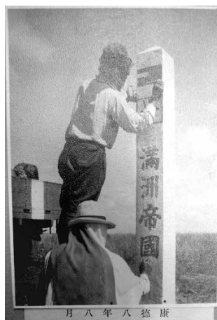
圖9：《滿蒙國境確定紀念寫真帖》