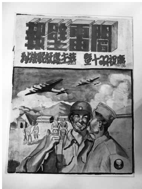
圖10：聞雷壁報：慶祝雙十暨蔣主席就職特刊

2009年，國會圖書館的工作人員首次發現了7幅手繪水彩抗戰文宣畫、壁報，其中包括「青年同胞們，快來投效空軍」、「爭取制空權，把敵人趕出去」等，大多與戰時中國空軍有關。這批手繪孤本保留至今，實屬罕見。（如圖10）