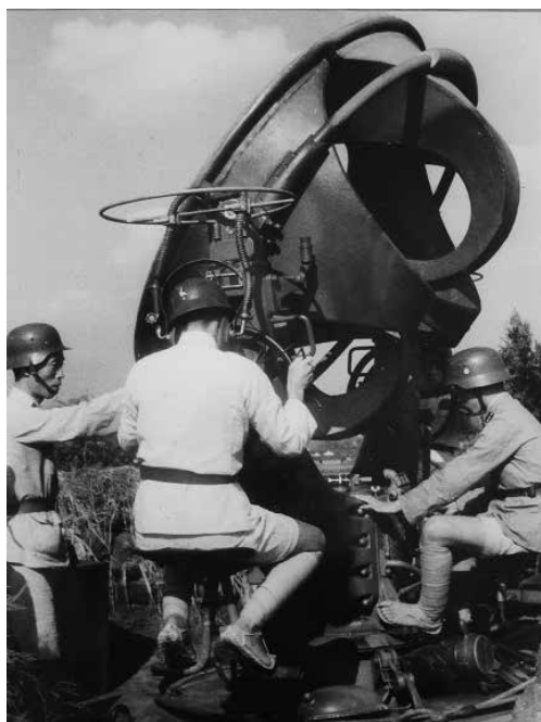
圖 2：用聲音探測敵機來襲的預警裝置

的軍事力量。「戰時中國（1938-1943）」照片中記錄了國民政府辦的軍官訓練團的軍訓。為了培養中、高級軍官，蔣介石於 1933 年在南昌開辦軍官訓練團。1935 年移駐廬山，成為著名的「廬山軍官訓練團」，蔣介石親任團長，具體事務由副團長陳誠負責。蔣介石曾明確將廬山訓練團稱為「第二個黃埔軍校」。廬山訓練團成立之初的目的是「反共」與「剿共」，在中日民族矛盾日益尖銳的情況下，1934 年後，訓練團中增加了有關抗日的教學內容。