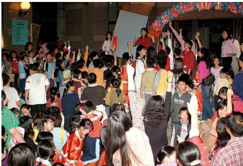
●猜猜樂燈謎晚會—台下民眾搶答盛況

活動高潮迭起，燈謎猜猜樂晚會於7時30分隨即登場，現場共準備60道謎題，由工作伙伴依序推出，在主持人恢諧又富技巧的提示下，總引來台下搶答聲不斷，五花八門的搶答道具紛紛出籠，萬頭鑽動好不熱鬧。為增添晚會趣味性，中間更穿插禮輕情意重的摸彩活動及「臺灣囡仔歌」童言童語、「我尚愛上閩南語課」講演，令人有耳