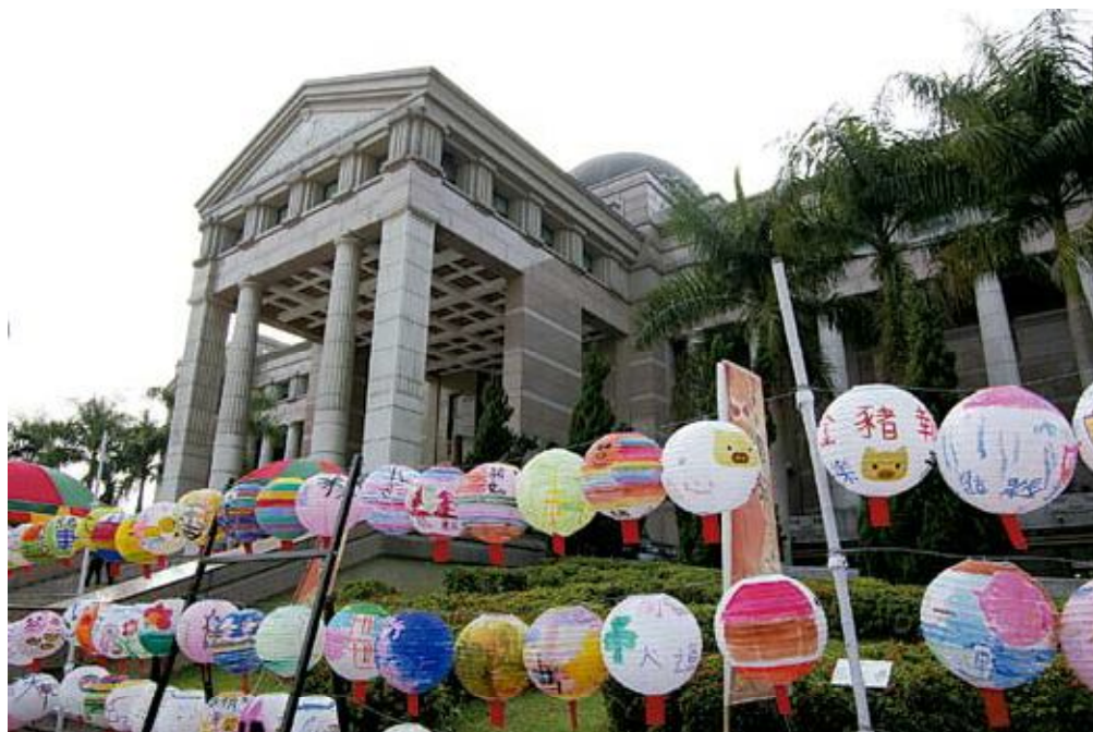
●彩繪燈籠成為園區特殊妝點

接著草鞋墩鄉土文教協會、臺灣工藝研究所也提供提燈踩街的「豬聯璧合」大小主題燈及「豬報平安」的竹工藝豬，放置於廣場供民眾留影紀念；另現場並設有知性充電站提供民眾認識元宵節之由來典故，而以「金豬賀歲」、「豬事大吉」為主題的鼓仔燈彩繪比賽、名師教授傳統竹篾燈籠製作活動相繼展開，許給孩童一個不同凡響的童年回憶。