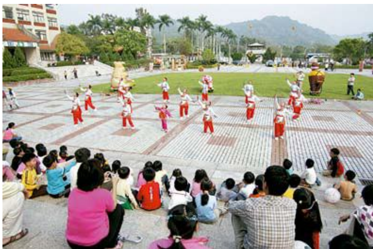
●嘉和國小學童精湛扯鈴表演剪影

有民俗傳統技藝展演、元宵節由來典故知性充電站、鼓仔燈彩繪及製作、吃湯圓分享福氣、提燈祈福夜訪中興新村及猜燈謎晚會等，並首次串聯鄰近機關、團體、國中、國小及社區媽媽，如地方行政研習中心、省府資料館、南投酒廠、臺灣工藝研究所、南投詩易經學會等共同參與，期藉由民俗技藝活動讓民眾體驗鄉土文化之美，並為精省後落寞的中興新村帶來些許年節熱鬧氣氛。