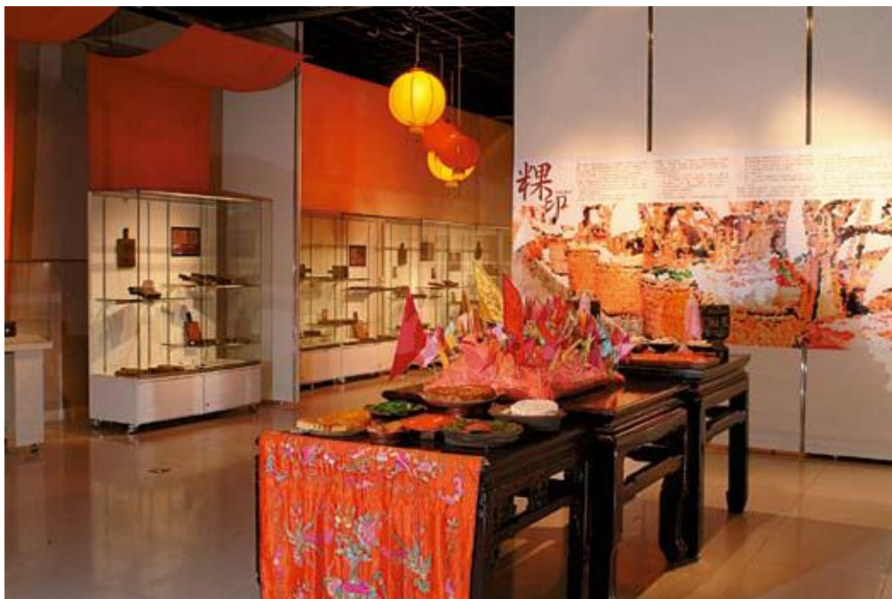
「臺灣粿印特展」之展場一隅，充滿著濃濃的年味

在臺灣歲時節令及民俗祭典，供桌上各式豐美的粿糕供品，是人們祈求圓滿人生及表達神祇崇敬最真實的投射與寫照。長久以來粿品已融入常民的生活禮數中，成為臺灣民間深具特色的飲食文化，充分