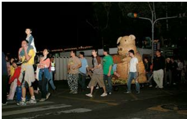
●祈福踩街—民眾熱烈參與