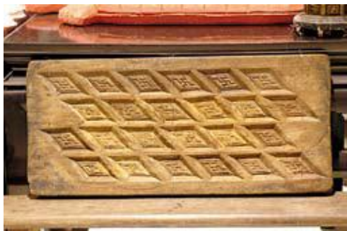
●長方大板方勝紋糕餅印