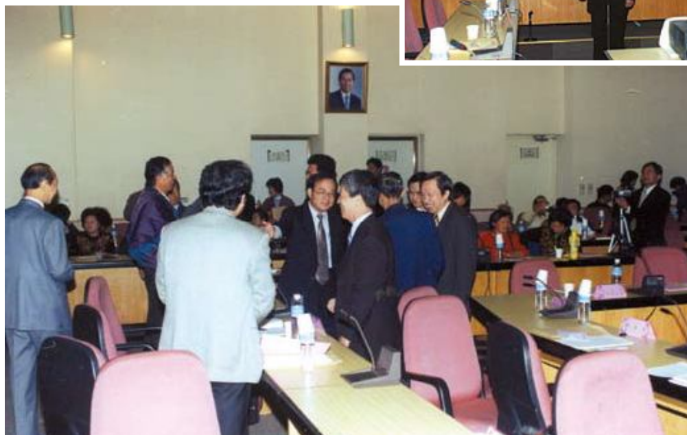
●改隸週年成果發表會