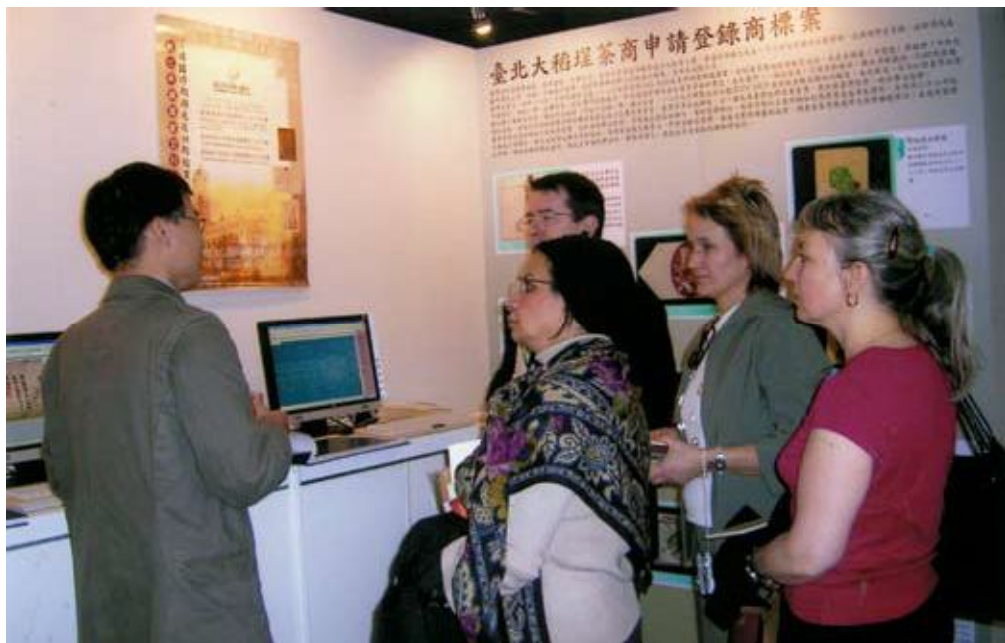
●數位化史料展吸引國際學者駐足洽詢

以「創意加值」為重心之數位典藏第二期國家型科技計畫將於今（96）年展開，本館已規劃提報「拓展臺灣數位典藏分項—臺灣省籍機關檔案數位化計畫」、「推動人文社會經濟產業發展分項—風華再現—宜蘭、埔里、嘉義觀光酒廠歷史文物加值應用計畫」、「數位典藏海外推廣暨國際合作網路推動分項—大航海時代臺灣涉外檔案整理推廣計畫」三計畫，結合本館一期數位化成果（包含史料、器物及出版品）基礎，期整合本館民俗文物及出版品數位化檢索系統計畫，建構以臺灣為主體之完整多媒體知識庫平台使用環境，令本館珍貴史料有別以往不同風貌，朝另一見山又是山境界展現。