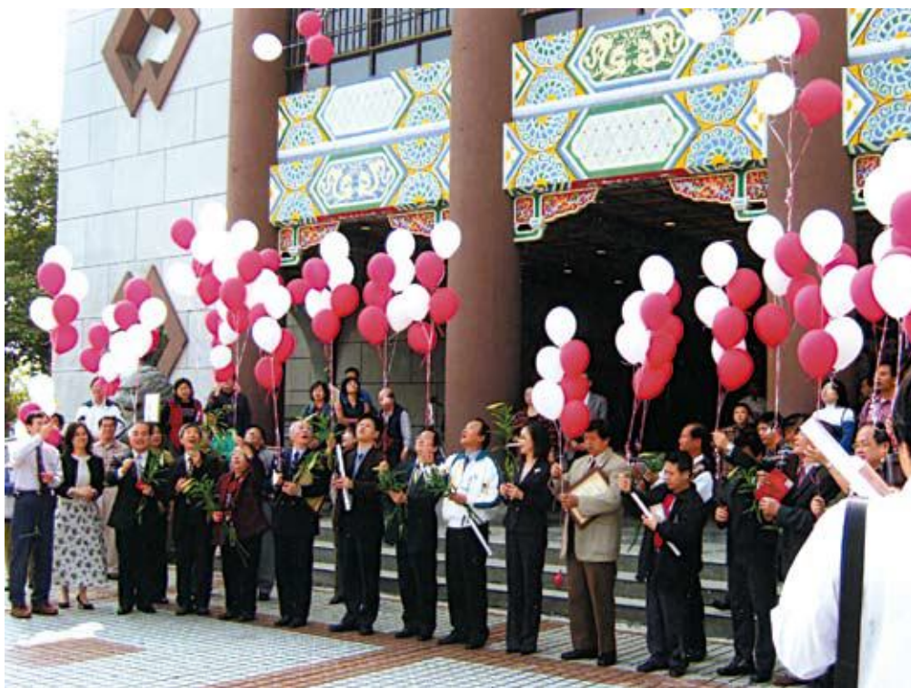
●二二八事件60週年紀念特展—飛揚和平 愛升空

96年2月28日至4月30日止展出，展出主題分別為「由期望到失望」、「臺灣島中心的反應」、「不同視角中的記載—官方與民間」、「228下的筆尖」、「傷痛的記憶」、「歷史的教訓與感懷」等六部分，展室內容包含檔案文件、書信、書籍、圖片，以及實物等展品為主，希望藉由展覽呈現當時對於228事件的反應，與從不同角