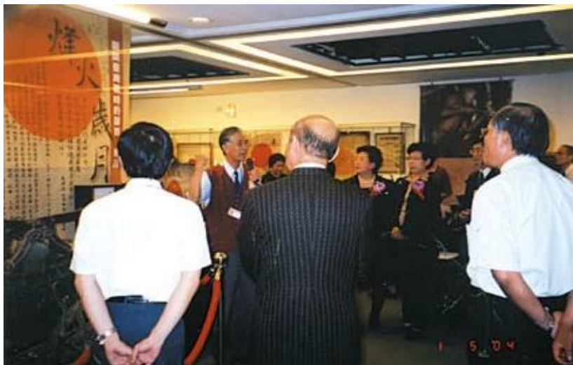
●烽火歲月特展—介紹戰時體制下的臺灣

93年3月1日至12月31日展出，在民國93年適逢終戰即將屆滿六十年，很多經歷那段苦難歲月的耆老，逐漸凋零，除了藉此向耆老表達敬意外，並可藉由擴大史料的系統採集及結合耆老的口述，使這段史實獲得更完整的保存。為增加特展深度及廣度，並規劃一系列的活動，包括圖錄的出版、耆老座談會、戰時遺跡勘考、影片欣賞、學術研討會等。