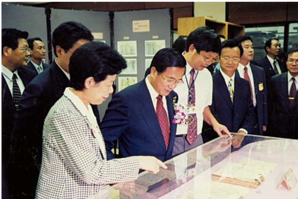
●陳總統蒞臨本館參觀總督府檔案展示(民國89年10月25日)