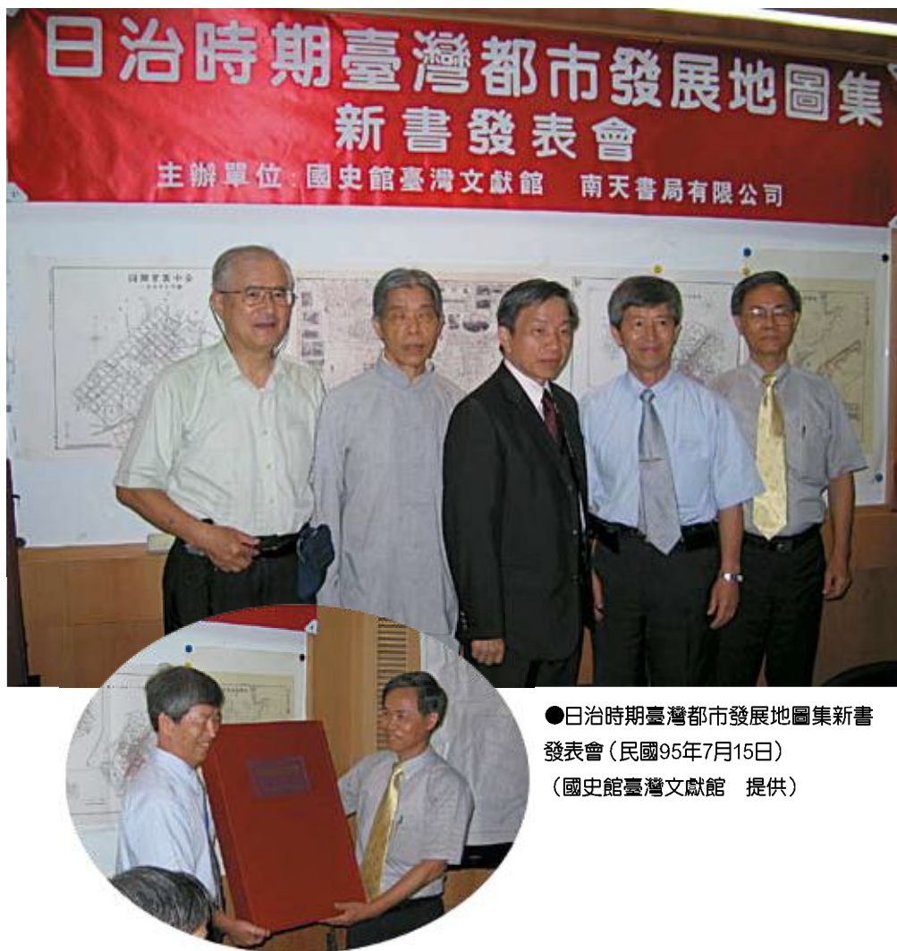
●日治時期臺灣都市發展地圖集新書發表會（民國95年7月15日）

92年3月召開「日治時期市區改正加值圖錄」編輯會議；4月邀請黃武達、施添福及賴志彰等教授召開「日治時期市區改正加值圖錄」編輯諮詢會議；同年10月委託黃武達教授進行地圖集編輯之調查及選件；11月與南天書局簽訂契約，共同製作《日治時期臺灣都市發展地圖集》；95年7月15日於臺北228紀念館辦理新書發表會。