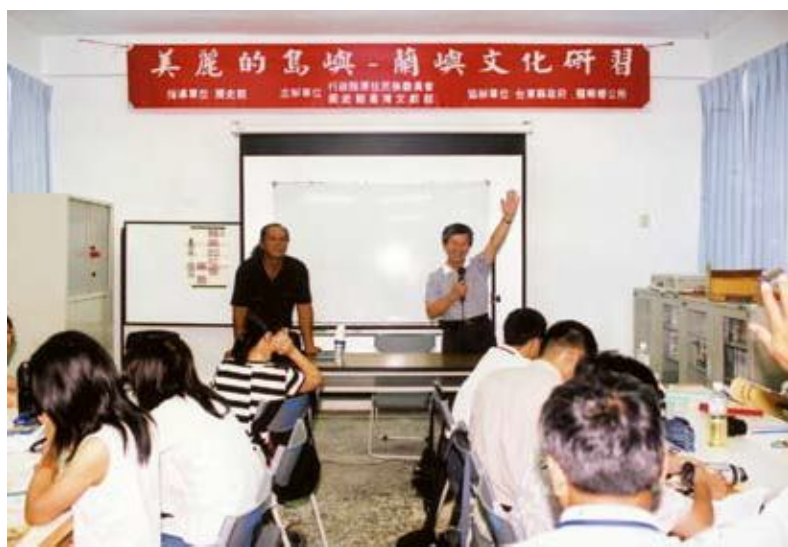
●美麗的島嶼—蘭嶼文化研習營

93年冬令「臺灣史研習營」假史蹟大樓簡報室辦理，自2月2日至2月6日，參加人數107人；93年冬令「美麗的島嶼—蘭嶼文化研習營」假臺東縣立蘭嶼中學辦理，自7月9日至7月12日，參加人數40人。