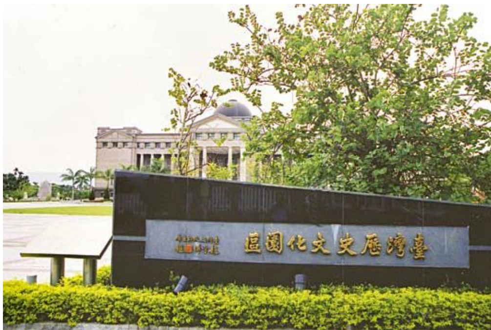
●臺灣歷史文化園區