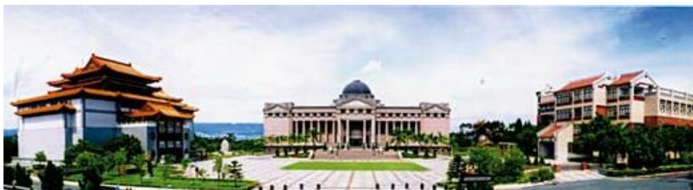
●本館館區宏偉與特色的建築

文獻大樓庋藏珍貴的文獻史料、典藏管理檔案、日文圖書等數十萬卷冊，建築外觀兼具閩南風格與現代精神，代表臺灣文化傳承。目前也是整理組與幕僚行政單位辦公場所。