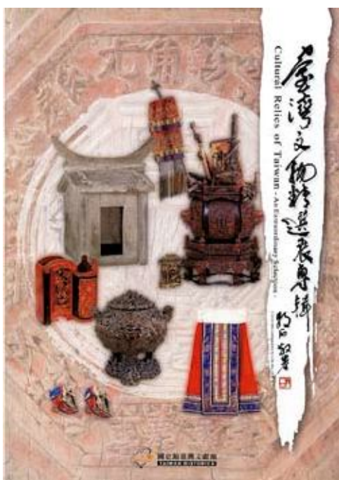
●代表臺灣參加海外書展之《臺灣文物精選展專輯》

94年編輯出版《古情綿綿—老臺灣簸仔店特展專輯》、《與甕相約—臺灣甕王選拔入選展專輯》，再版《臺灣文物精選展專輯》。《臺灣文物精選展專輯》於94年1月榮獲臺北國際書展「Best From Taiwan版權推介」非文學類入選作品，除於2月15-20日於臺北世貿大樓一館展覽，並代表臺灣於義大利波隆那、韓國首爾、德國法蘭克福國際書展展覽。