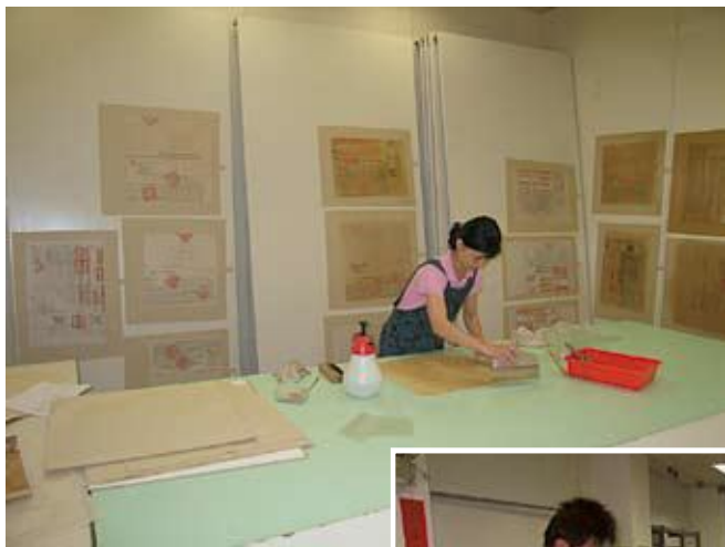
●典藏數位化前置裱褙作業