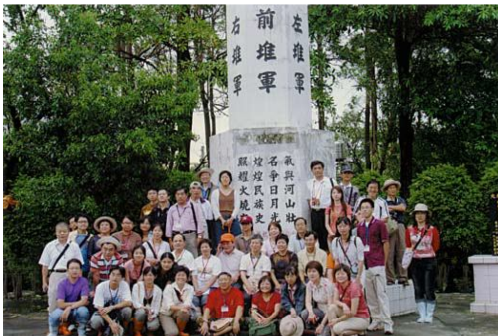
●臺灣史研習營戶外史蹟踏勘