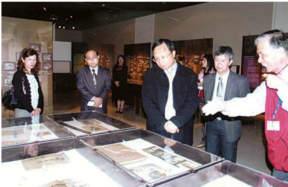
●教育部杜正勝部長參觀「棟花盛開時的回憶」史料特展