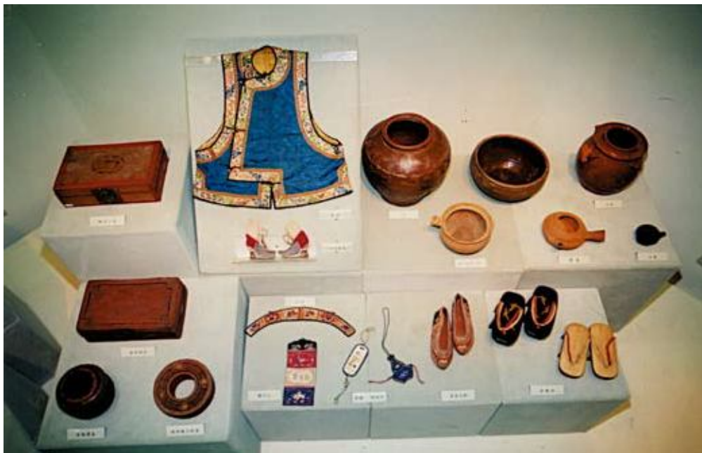
●文物大樓展場略影(二)