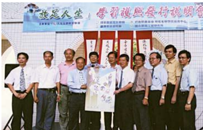
●策略聯盟推動學習護照發行