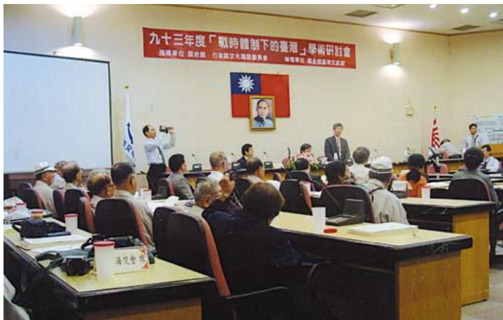
●「戰時體制下的臺灣」學術研討會

(1)93年10月26~27日配合本館自行策劃之「烽火歲月—戰時體制下的臺灣史料特展」舉辦「戰時體制下的臺灣」學術研討會。