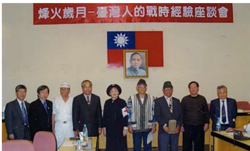
●烽火歲月特展—重溫戰時經驗