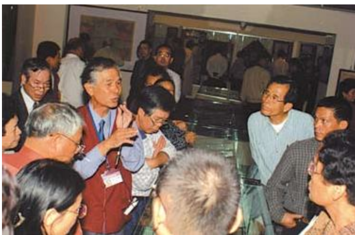
●民眾參觀特展仔細聆聽 志工精彩導覽