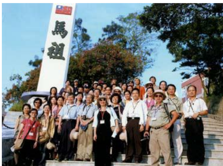
●臺灣史研習營尋訪閩江口的明珠—馬祖