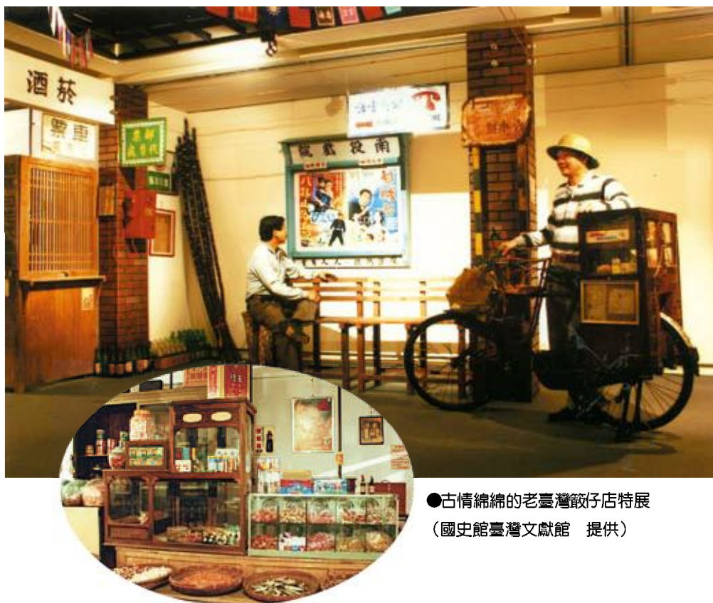
●古情綿綿的老臺灣餛飩店特展