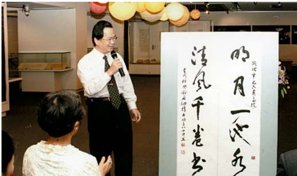
●謝館長親自介紹書法大師陳其銓墨寶