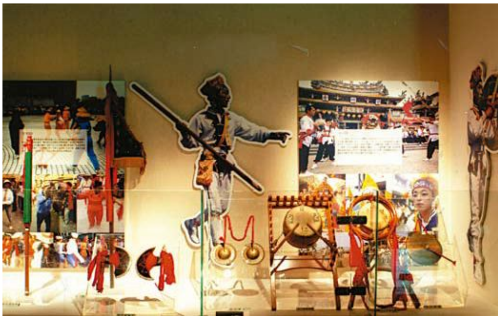
●文物大樓展場略影(一)

文物大樓於90年12月27日全面開館營運。對外營運空間包括六間常設展示室及福爾摩沙、蓬萊鄉情二間特展室。常設展展出本館歷年典藏民俗文物一千餘件，特展室則以邀請展、申請展及自行策展方