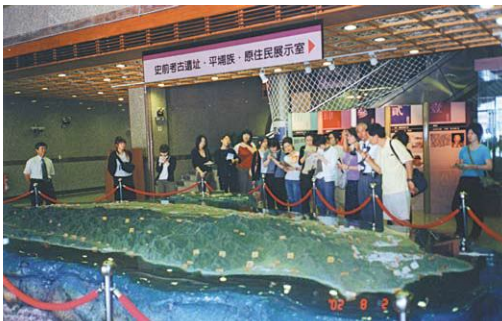
●專業志工引導青年學子親近臺灣史

積極培訓志工，先後辦理文物大樓導覽解說志工講習會及導覽解說種子志工培訓，以提升服務品質。