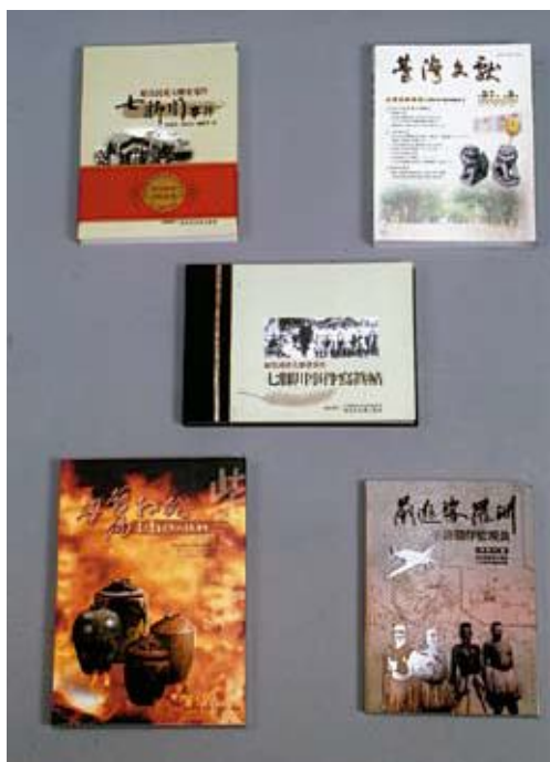
●行政院研考會評鑑優良出版品 （國史館臺灣文獻館 提供）

本項專題計畫目前已出版《原住民重大歷史事件—七腳川事件》、《原住民重大歷史事件—七腳川事件寫真帖》、《布農族部落起源及部落遷移史》、《原住民部