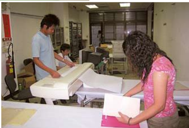
●典藏數位化檔案掃描作業 (國史館臺灣文獻館 提供)