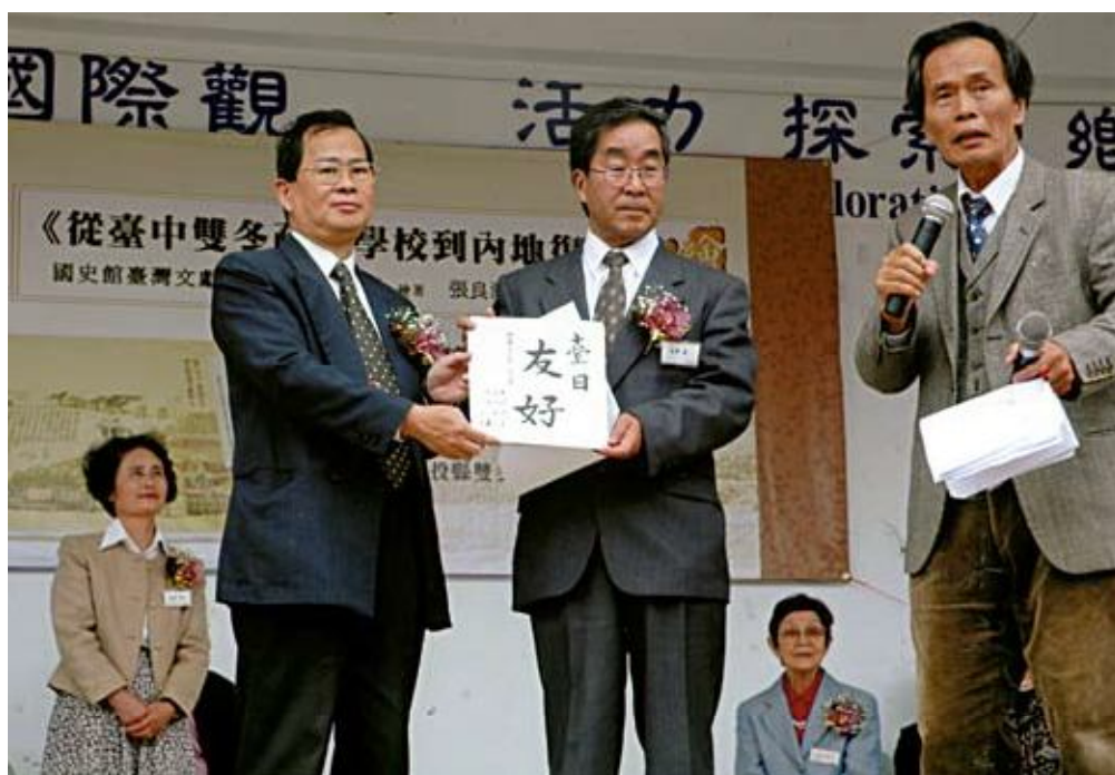
●《臺中雙冬疏散學校到內地復員》新書發表會日本友人贈送畫軸珍貴史料

4.95年度出版與太平洋戰爭有關的史料《從臺中雙冬疏散學校到內地復員》繪卷及新書發表會。