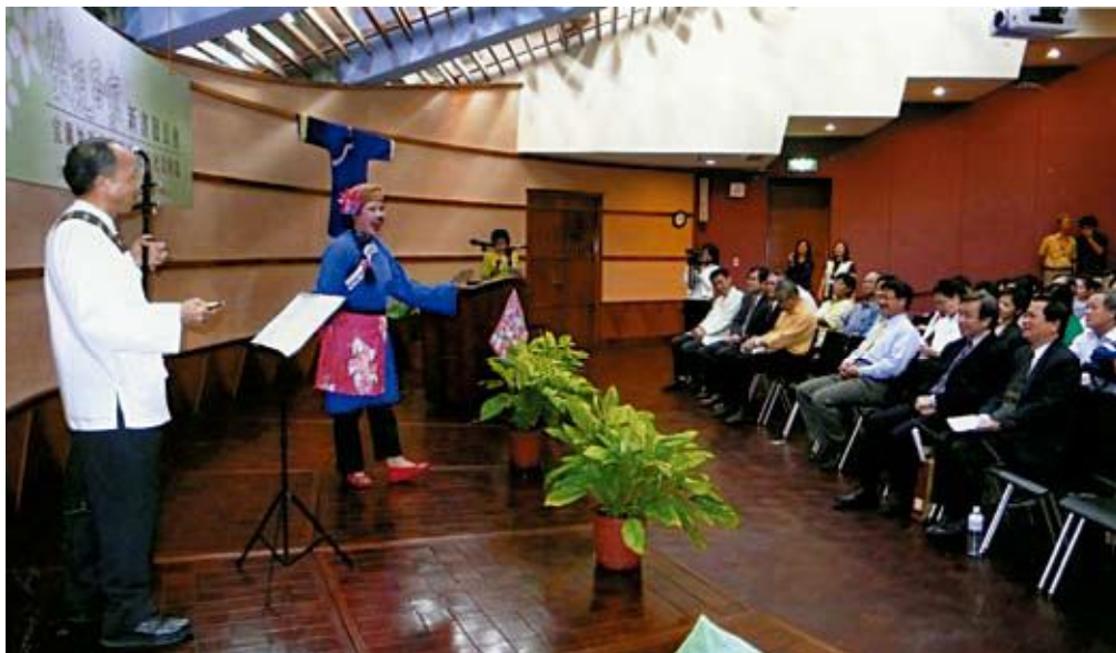
●發現客家新書發表會盛況