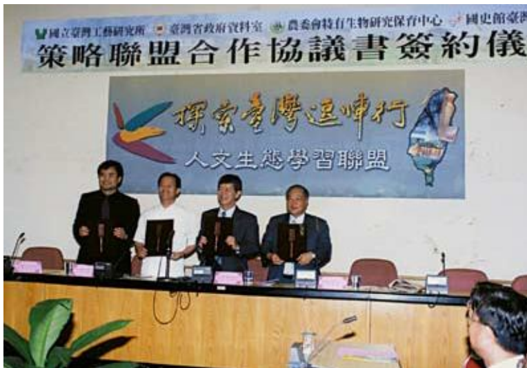
●策略聯盟締盟協助館務行銷

第二：結合觀光旅遊界，辦理觀光與臺灣歷史文化研習營及推動機關策略聯盟與締結姊妹館，希望有效推廣本館各項展示設施，成為觀光活動的資源。例如邀請中部四縣市教育主管機關，請其將本館列為國中、小學戶外教學的參觀場所。又如在松山與桃園機場設置燈箱廣告、總統府內設置臺灣總督府文獻陳列展示室、推動與國立臺灣工藝研究所、臺灣省政府資料館、農委會特有生物研究保育中心及臺灣菸酒公司南投酒廠策略聯盟，及中正機場文物展示與臺鐵臺北車站文物聯展等，都是加強業務行銷的有效作為。