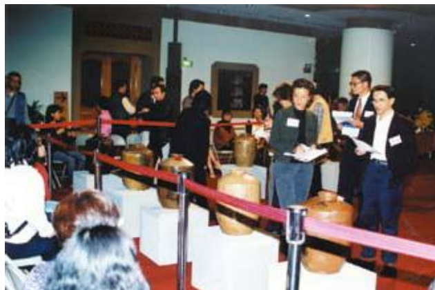
●評審仔細評鑑甕王選拔

94年辦理「古情綿綿—老臺灣餛飩店特展」、「客家風情百年窯火—苗栗陶特展」特展。