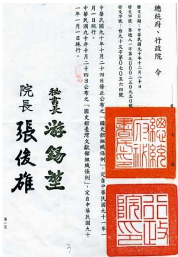
●「國史館組織條例」自中華民國91年1月1日施行令