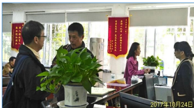
湖北省檔案館閱檔大廳

對於檔案的應用，除了查詢目錄調閱檔案資料外，我們所參訪的檔案館皆充分挖掘與利用其館藏資源，編研出版檔案史料書籍、舉辦