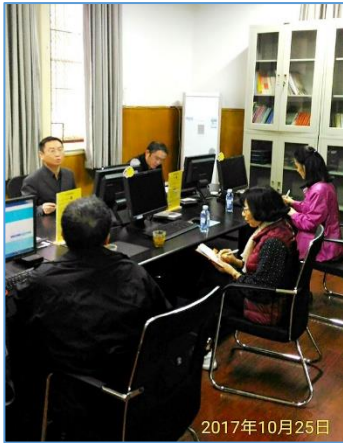
與武漢市檔案館 各業務單位座談

其數字化處理範圍，從調卷整理到編目資料與掃描圖檔結合上傳服務，以及裝訂還原歸卷，皆由得標廠商全部承攬，幾乎涵蓋了審編處各科絕大部分業務，這是我們前所未知的狀況，但中國大陸這幾年為加速趕上數字化的腳步，已是普遍的作法，至少我們所參訪的機關（構）皆如此處理。一如湖北省檔案館謝絕參