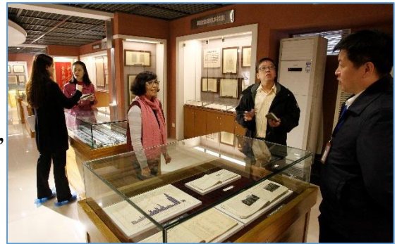
湖北省檔案館特藏庫

湖北省檔案館特藏庫面積 400 餘平方米，建成於 2008 年 4 月，今年 3 月重新布展。該庫房恆溫恆濕，兼具藏、展兩種功能，所謂上展下藏 2 ，是由全部館藏 80 多萬卷檔案中，依據內容重要、價值珍貴、載體特殊等原則，挑選出來的原件珍品。包括前清時期、北洋政府時期、國民政府時期、中共建政以後等四個時期，展示的有：錢幣、紙鈔、政府公告、湖北省政府檔案、中共中南區檔案、報紙、文物、照片、圖書、字畫等。目前展出的三百餘件珍品中，包括入選《中國檔案文獻遺產名錄》