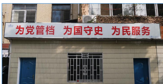
為黨管檔 為國守史 為民服務

檔 為國守史 為民服務」幾個大字的招牌，充分顯現「黨」在中國大陸的優先性。檔案保護中心的數字化加工場所，自檔案的調卷整理、修裱仿真、編目審查、數位掃描至