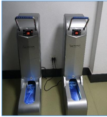
鞋套自動穿戴機

館方表示不便開放一般庫房，但歡迎我們參觀檔案館 11 樓的特藏庫。在入口處，安全措施嚴格，每個人先將背包、手機放於置物櫃內，通過金屬偵測器後，走到鞋套自動穿戴機前，左、右腳分別踏入機器內，即可自動套上鞋套，徹底避免入庫者將灰塵雜物帶入庫房，甚為便利先進。