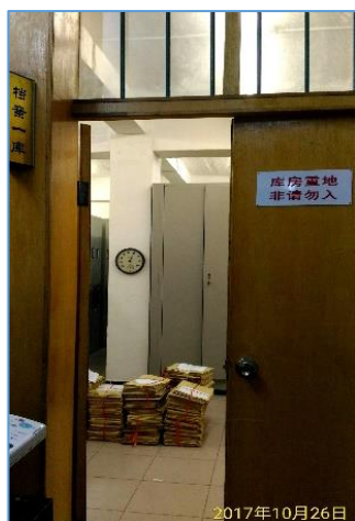
武漢大學檔案館 庫房門口

公務繁忙的涂上飆館長抽空與我們進行業務交流，由於館長是歷史研究者，表示蔣檔開放對民國史研究深有助益，我們告知其他各全宗檔案在原機關解密後會陸續開放，涂館長提到該館檔案解密由學校保密委員會審定。館方人員詢問本館是否有王世杰先生任職武漢大學校長時期的資料，以及武漢大學成立的正式公文書。經查本館館藏結果，並無相關資訊。下午，我們極力要求能有機會瞭解並參觀檔案庫房，羅主任基於彼此是同行，破例同意開放檔案館 1 樓略嫌擁擠的庫房。