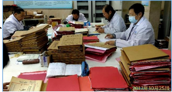
武漢市檔案館典藏整理作業

中國大陸各級國家檔案館典藏檔案的種類包括文書檔案、科技檔案、會計檔案、聲像檔案、電子檔案、實物檔案（包括公務禮品檔案等）、專業檔案及其他對黨和國家、社會有保存價值的相關資料。 10 原則上檔案原件不得出館，因特殊需要必須出館時，需經局（館）長簽批。 11