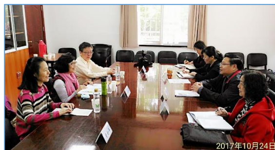
與湖北省檔案館各業務單位座談

襲，損失慘重，抗戰後期又被美軍轟炸，所以想找相關資料。但我們回來後尋查館藏檔案，亦缺乏這方面的文件。