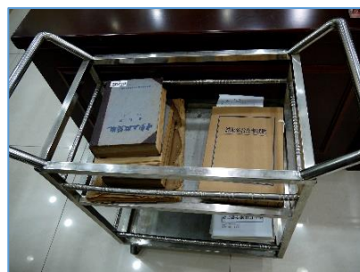
湖北省檔案館提供 讀者用檔案車 (吳恭全攝)

查閱已開放檔案，若是中華人民共和國和國的公民，以提供合法身分證明即可；若是港、澳、臺胞和外國人，則需由相關部門介紹，並經檔案館同意。查閱指