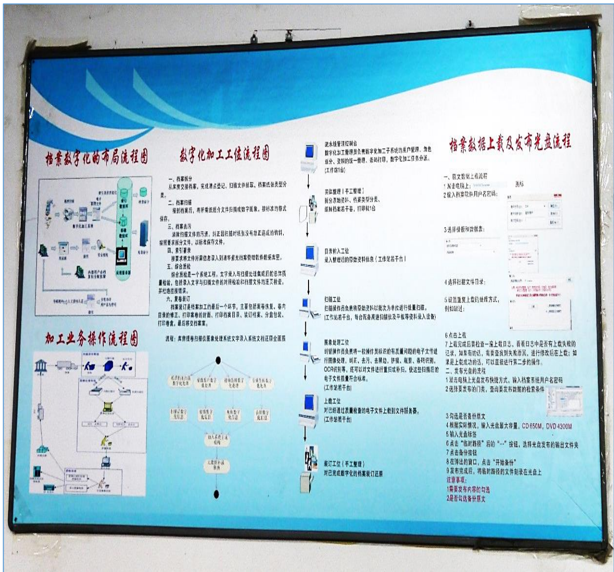
武汉市档案馆数字化流程图

武汉市档案馆制訂《武汉市紙質檔案數位化實施細則》，詳細規範檔案數位化流程，從檔案出庫、處理裝訂物、分件、編頁、編目、修復、目錄建庫、檔案掃描、影像處理、圖像存儲、圖像掛接、檔案資料自檢、檔案裝訂還原、檔案實體驗收入庫、數位化工作文檔整理、數位化成果驗收、資料備份到成果移交，外包公司承攬了所有項目。