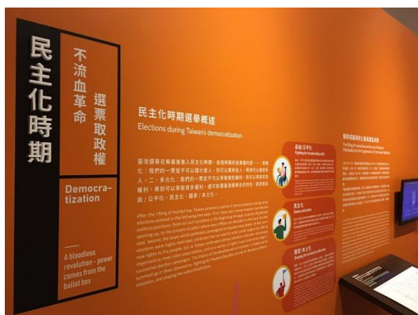
概述民主化時期選舉之發展趨向