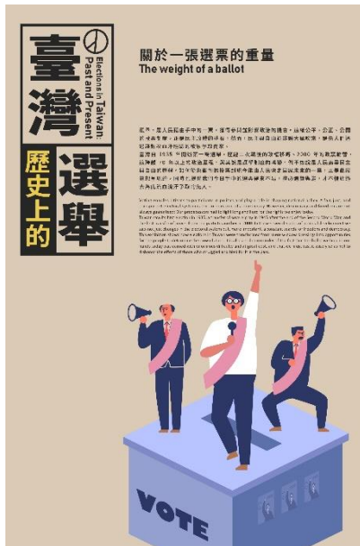
「臺灣歷史上的選舉」展示概述