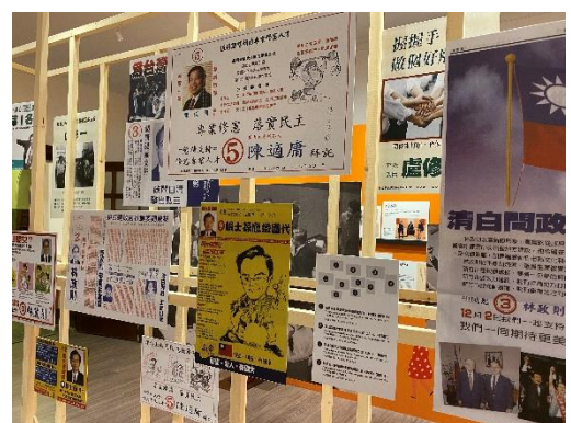
文宣牆方式闡釋我國競選主軸 以民為主訴求的轉變