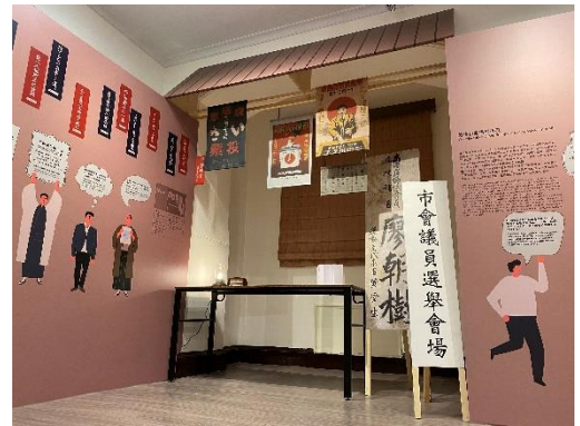
展間仿舊方式呈現日治時期 選舉文宣