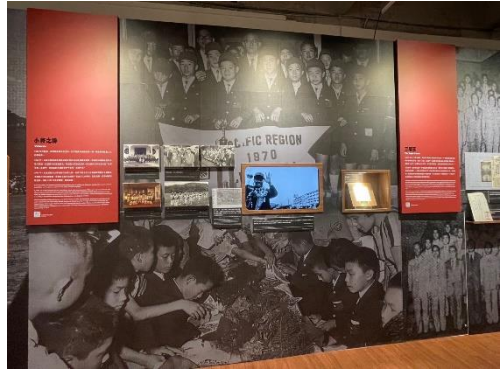
透過珍貴影音播放，重回 1969 年第 23 屆世界少年棒球大賽現場