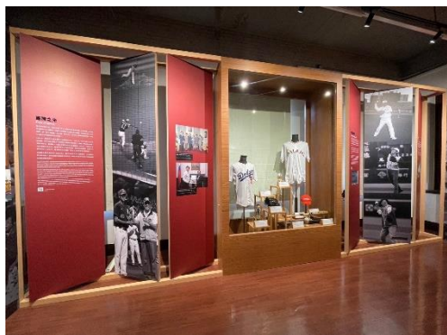
展場陳列許多總統副總統禮品類文物，如簽名球衣、手套等。