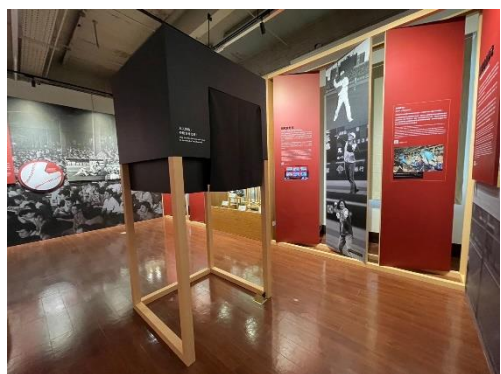
設有「盲人棒球」互動裝置供民眾體驗