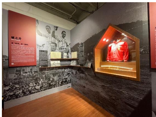
展場一隅，展場圖像、文字與文物並陳豐富