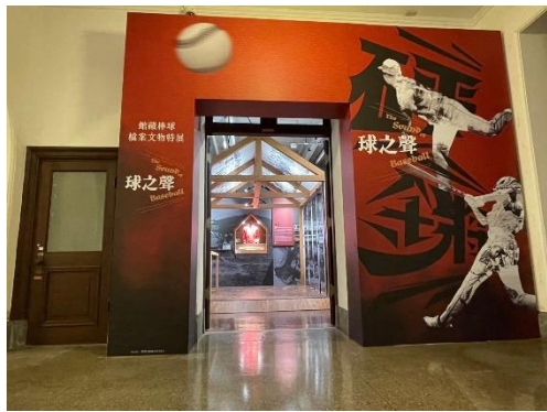
展覽入口之迎賓牆