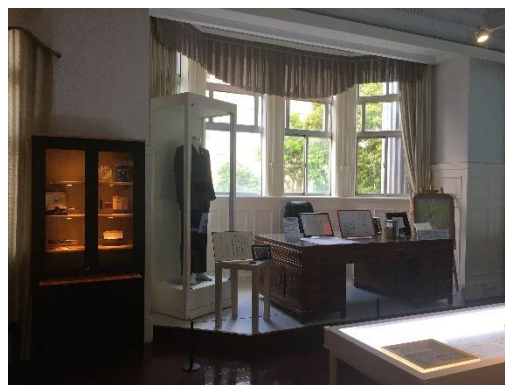
國史館「關鍵 1991：李登輝與臺灣民主元年」展場一隅